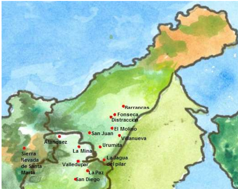
Figura 2. Distribución de formas vocales diptongadas en el corredor del Valle del Cesar