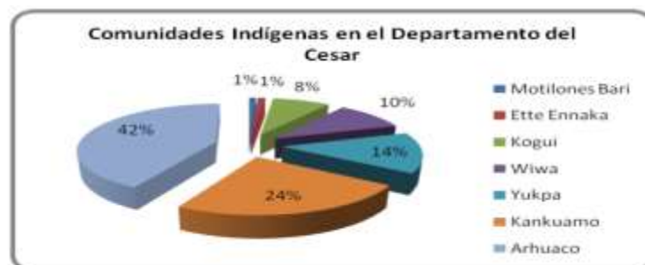
Gráfico 1. Comunidades Indígenas en el departamento del Cesar .

Las comunidades indígenas que se encuentran en el Departamento del Cesar están repartidas en siete etnias, que a su vez se distribuyen en catorce resguardos. La gran mayoría de estas etnias se diseminan a lo largo y ancho de la Serranía del Perijá y La Sierra Nevada de Santa Marta; y otros más en municipios cercanos a estos lugares, como Valledupar, Becerril, Codazzi, etc. Según el censo de 2005, se registra la existencia de siete etnias en el departamento: ette ennaka, motilones bari, kogui, wiwa, yukpa, kankuamo y arhuaco (Gobernación del Cesar, 2009). Según datos del Censo 2005, se estima que la población con mayor porcentaje demográfico es la comunidad arhuaca (42 %), mientras que la comunidad kankuamo ocupa el segundo lugar (24 %) de población indígena en el Departamento del Cesar.