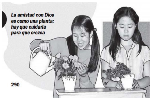
Ilustración 6.

(30) Para estar en forma, hay que hacer ejercicio; para tener una buena relación con Dios, hay que estudiar la Biblia (WTBTSP, 2011, p. 275).