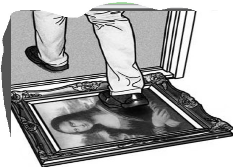
Ilustración 2.

El ejemplo más contundente de esta metáfora es el (14), que además se acompaña de la imagen referenciada en la Ilustración 2.