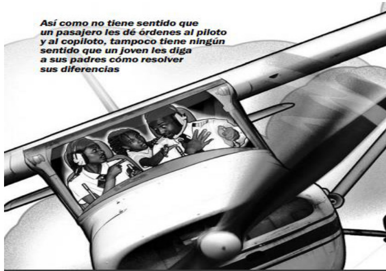
Ilustración 5.

(29) Los padres son como los socorristas de la playa: están en mejor posición que tú para ver los posibles peligros (WTBTSP, 2011, p. 269).