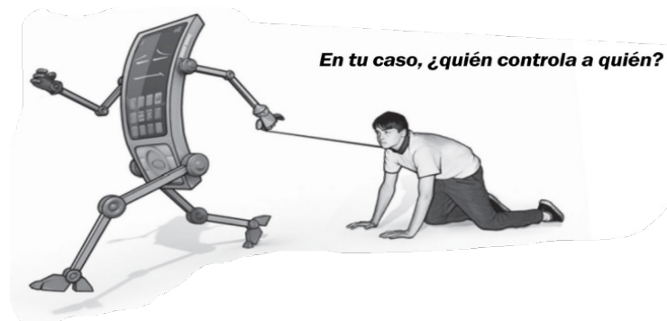
Ilustración 4.

(20) La pornografía te ata cada vez más: cuánto más la veas, más difícil te será dejarla (WTBTSP, 2008, p. 276).