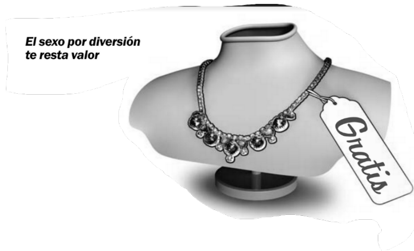
Ilustración 3.

(15) El sexo por diversión te resta valor (WTBTSP, 2011, p. 187).