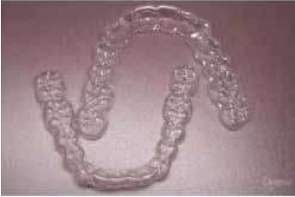
Figura 1. Fotografía de retenedor tipo Essix utilizado en el estudio