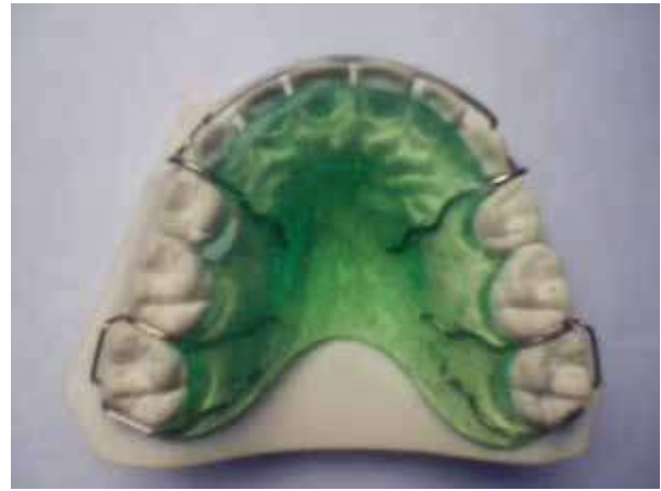
Figura 2. Fotografía de retenedor tipo Hawley utilizado en el estudio