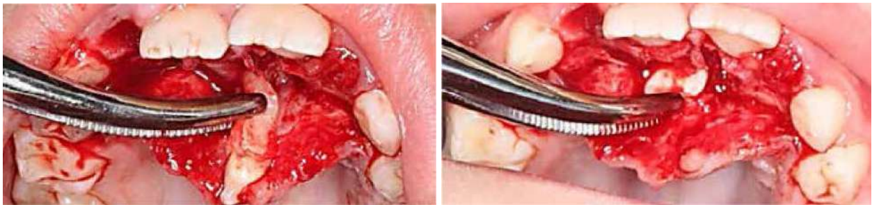
Figura 5. Remoción de dientes supernumerarios