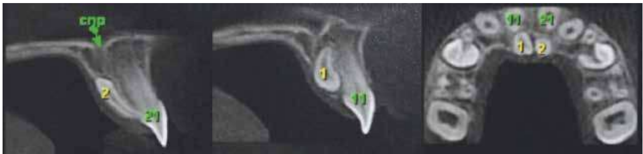
Figura 3. Imagen tomográfica en la que se observa la localización y posición de los supernumerarios

Figure 2. Intraoral periapical radiograph showing conical mesiodens