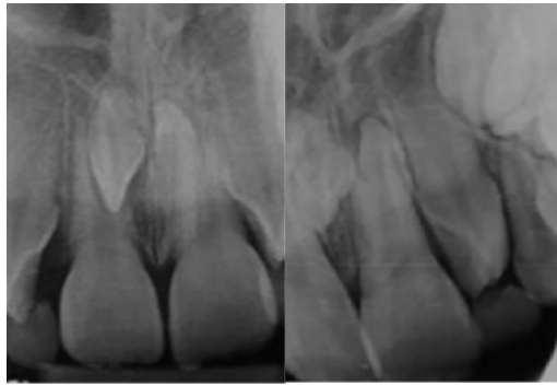
Figura 2. Radiografía periapical en la que se observan los dientes supernumerarios

A periapical radiograph was requested and analyzed by means of the Clark radiographic technique (Figure 2) and for better visualization and planning a cone-beam computed tomography (CBCT) was taken, confirming the presence of two supernumerary teeth between central incisors (mesiodens) in inverted position. Also, there was not root resorption of the permanent roots of this region and no evidences of associated pathologies (Figure 3).