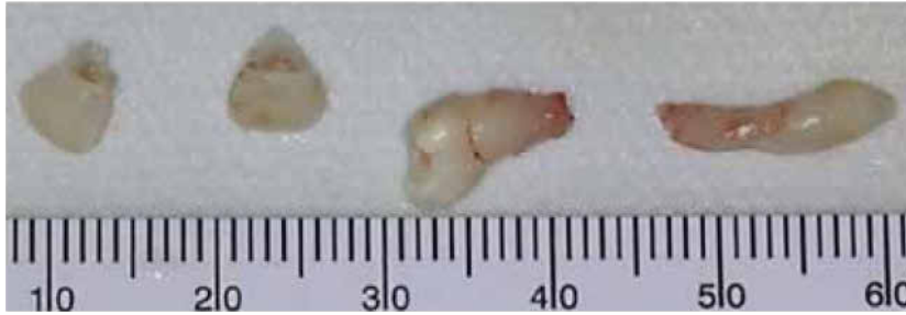
Figura 7. Dientes extraídos en la cirugía.

Figure 7. Supernumerary teeth and lateral incisors extracted