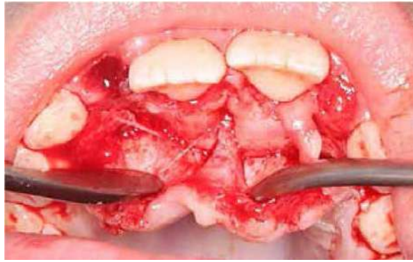
Figura 4. Aspecto del sitio con los dientes supernumerarios incluidos