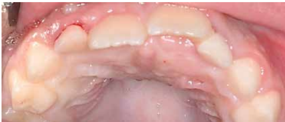
Figura 1. Aspecto clínico de la cavidad oral, con aumento de volumen en la región de los incisivos

An 8-year-old girl was referred to the surgery department with complaints of swelling in the palate and pain when masticating. The intraoral examination showed swelling in the anterior palatal region without no mucosa color alteration. The patient had normal mixed dentition with no other abnormalities (Figure 1). There were no signs of syndromes.