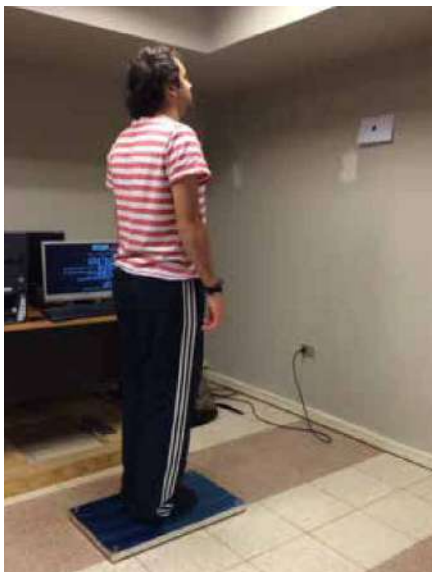
Figura 1. Plataforma de fuerza Kistler® modelo 9286BA

30 subjects were selected consecutively. Each selected subject was asked to step barefoot to the model 9286BA Kistler® force plate (Figure 1) in order to collect the data corresponding to their plantar center of pressure and their variations by inducing a gradual anteposition of the head. The Bioware software was used to collect data.