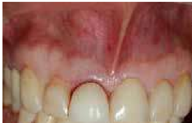
Figura 1. Lesión tumoral en zona vestibular a nivel del órgano dentario 11

(Figure 1) with no pain. The clinical examination showed a crown with cast core. The x-ray examination showed the presence of an endodontic treatment apparently well filled and a radiolucent periapical area extending to dental organ 12 (Figure 2). Treatment was explained and an informed consent was signed. Infraorbital anesthesia was applied reinforced with infiltration anesthesia of 2% lidocaine with epinephrine 1:80000. An internal bevel incision was made to raise a subperiosteal flap, performing full excisional biopsy of the lesion, which measured nearly 1 x 1 cm, followed by curettage of the surrounding areas to remove possible residues of granulomatous tissue, apicectomy and retrograde filling with MTA (Dentsply), which was prepared following the manufacturer's instructions (Figure 3). The histopathological study of the removed tissue showed a lesion covered by histiocytes with some neutrophils, macrophages, lymphocytes and plasma cells, showing compatibility with periapical granuloma wall (Figure 4). A 6-months post-treatment follow-up was conducted. The patient was asymptomatic and the radiographic examination showed repair of the radiolucent area at the apical end of the DO (Figure 5).