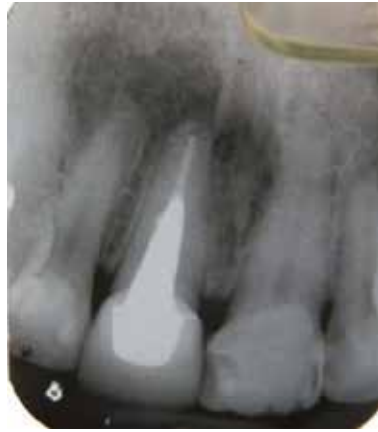
Figura 2. Zona radiolúcida circunscrita ubicada en el periápice del órgano dentario 11