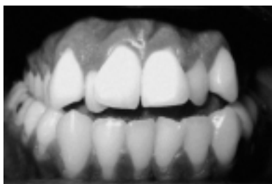
Figura 5 Asimetría esquelética asociada a una deficiencia transversal del maxilar

La etiología de la deficiencia transversal maxilar es multifactorial, incluyendo factores congénitos, de desarrollo (hábitos de succión digital), traumáticos e iatrogénicos (corrección de paladar hendido). 26 El diagnóstico de esta condición puede ser difícil debido a que el maxilar tiene menor cantidad de tejido blando de soporte y sus cambios son mínimos en la hipoplasia transversal aislada del maxilar. Los cambios en los tejidos blandos están limitados a una depresión paranasal y a una base nasal angosta. En contraste, el diagnóstico de la desarmonía vertical y sagital del maxilar son más fáciles debido ya que son obvios los cambios de los tejidos. Por lo tanto, cuando se presenta una deficiencia del maxilar, las displasias sagitales y verticales pueden enmascarar la deformidad en la dimensión transversal. Hay varias características clínicas que sobresalen en la deficiencia transversal: mordida cruzada unilateral o bilateral; apiñamiento, rotación y desplazamiento hacia palatino de los dientes; estrechamiento de la forma del arco y bóveda palatina alta. (figura 5).