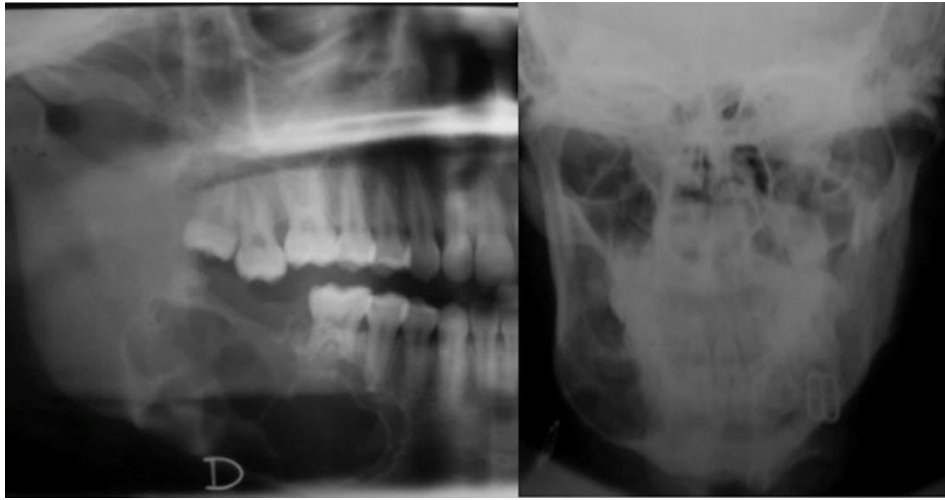
Figura 1. Lesión osteolítica que produce rizálisis de 4.6 y 4.5