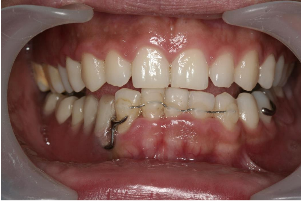
Figura 3: Control a los 10 años