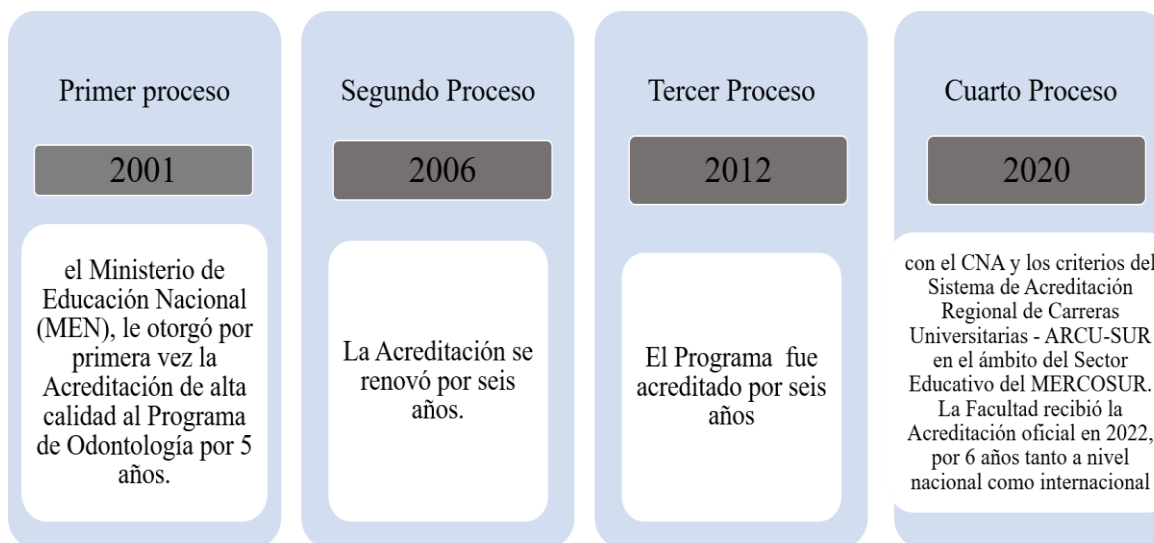
Figura 1. Línea de tiempo en los procesos de autoevaluación institucional

La Universidad de Antioquia, desde finales de los años 90, inició los “procesos de autoevaluación con fines de acreditación” bajo los lineamientos del Consejo Nacional de Acreditación CNA de Colombia; apoyado en el Comité Central de Autoevaluación y Acreditación y en el Comité específico, la FdeO UdeA Med Col liderando los procesos de autoevaluación que a continuación se presentan: