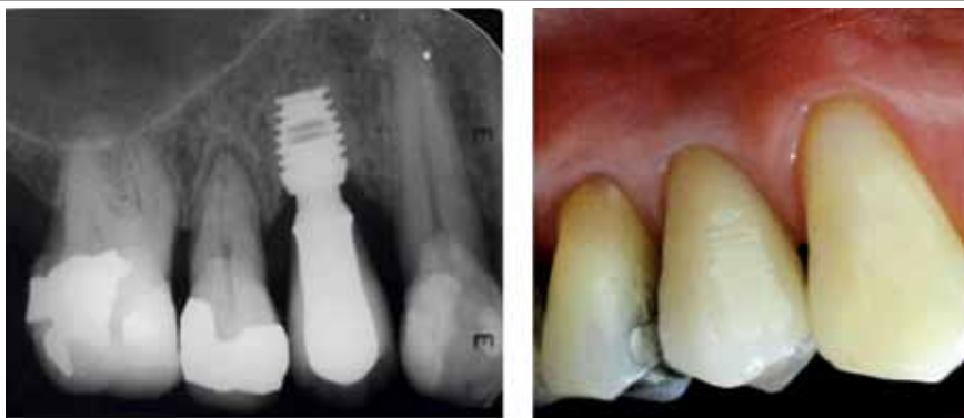
Figura 3. Caso clínico. Implante corto Bicon restaurado

In evaluating tissue stability, a minimal variation in clinical crown length was found in the apical-coronal direction of our restorations; an average 0.5 mm recession was observed six months after restoration, which is similar to the measurements reported with implants of external connection, dual-stage surgery and follow-ups of six 8 and twelve months (0.6 mm). 13 Analysis of the soft tissue surrounding the implant during the six-month period of this study suggests the presence of a band of keratinized gingiva at different measurement times, with a final average measure of 3.50 mm; this finding agrees with the studies that have demonstrated the benefit of the presence of a band of keratinized gingiva as a favoring factor for soft tissue stability. 32-34