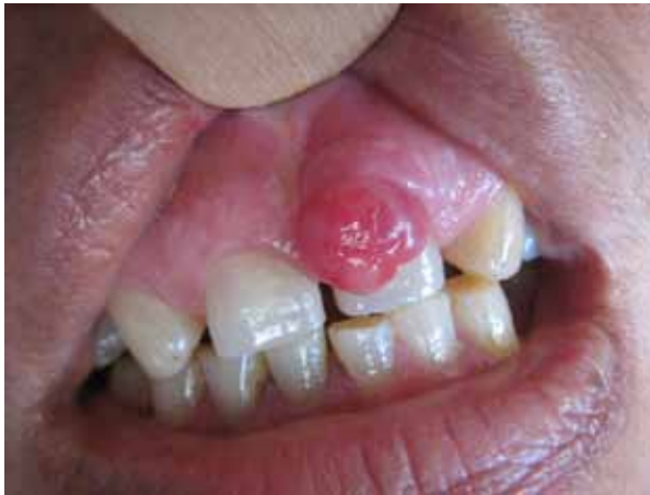
Figura 3. Lesión tumoral en zona de encía vestibular del diente 21 de un color rojo brillante

The microscopic histopathological description consisted of tissue fibrocollagen proliferation, highly vascularized, with chronic inflammatory cells of the polymorphonuclear neutrophils type, and ulcerated areas. It was negative for malignancy and showed no atypia. Also, it was compatible with telangiectatic granuloma (figure 4).