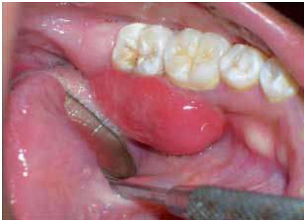
Figura 1. Lesión tumoral en la encía lingual a nivel de los dientes 35, 36 y 37

Figure 1. Tumorous lesion in the lingual gingiva associated with teeth 35, 36 and 37