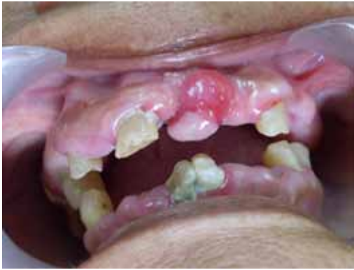
Figura 5. Lesión tumoral en zona de encía vestibular del diente 21