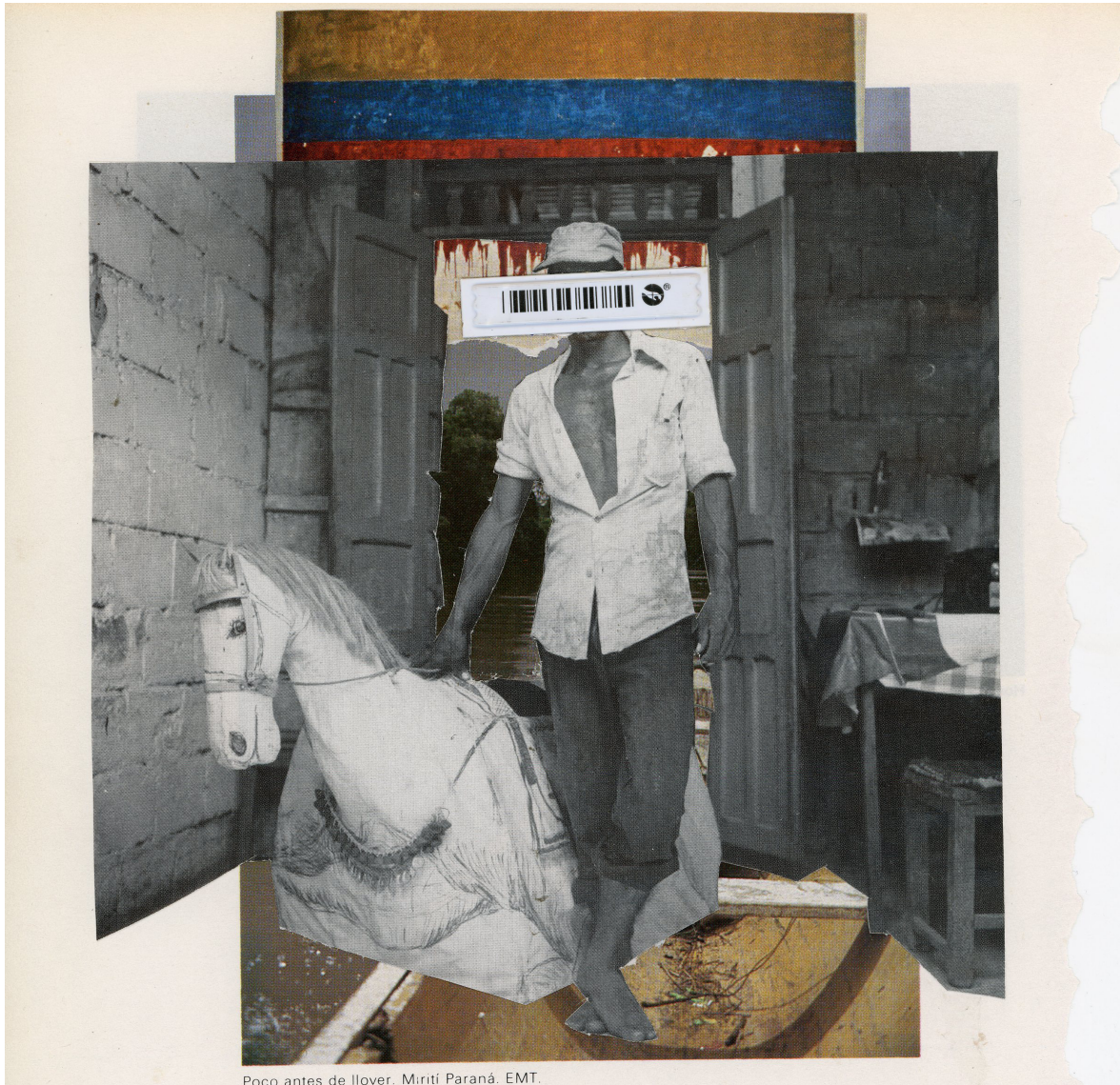
Poco antes de llover. Mirití Paraná. EMT.