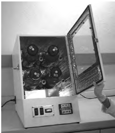
Figura 1. Incubador Sistema Ankom Daisy II ® (3)

de raza blanco orejinegro o BON ( Bos taurus ) fistulados al rumen, con peso vivo promedio de 483 kg y pastoreando la gramínea pará ( B. mutica ), con forraje en oferta de 12% de PC, 68% de FDN, 33% de FDA y DAIVMS de 61.6%. El líquido ruminal fue mezclado en igual proporción de cada uno de los novillos. La preparación de las soluciones tampón (1600 ml/jarra) se realizó en condiciones anaerobias permanentes, a las cuales se le agregó a cada una 400 ml de líquido ruminal previamente mezclado y filtrado por dos bolsas de nylon con tamaño de poro de 50 \mu\text{m} .