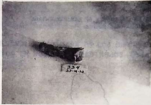
FIGURA 1. Coloración rosada en diente de Bovino con "Cromatosis".