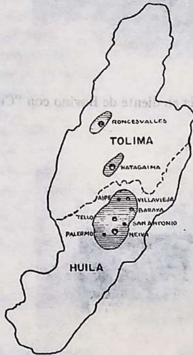
FIG. 4 MUNICIPIOS EN LOS CUALES SE HAN PRESENTADO CASOS DE CROMATOSIS BOVINA.