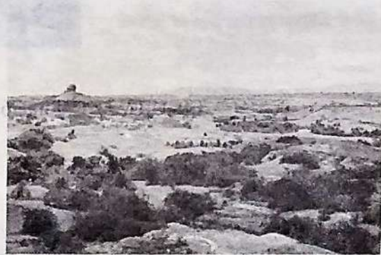
FIGURA 5. "Zona de Cromatosis", municipio de Tello (Huila).