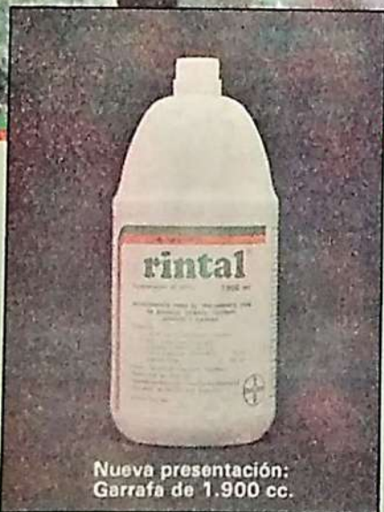
Nueva presentación: Garrafa de 1.900 cc.

Es cierto..! Animales tratados con Rintal normalizan su apetito, aumentan el peso e incrementan su producción.