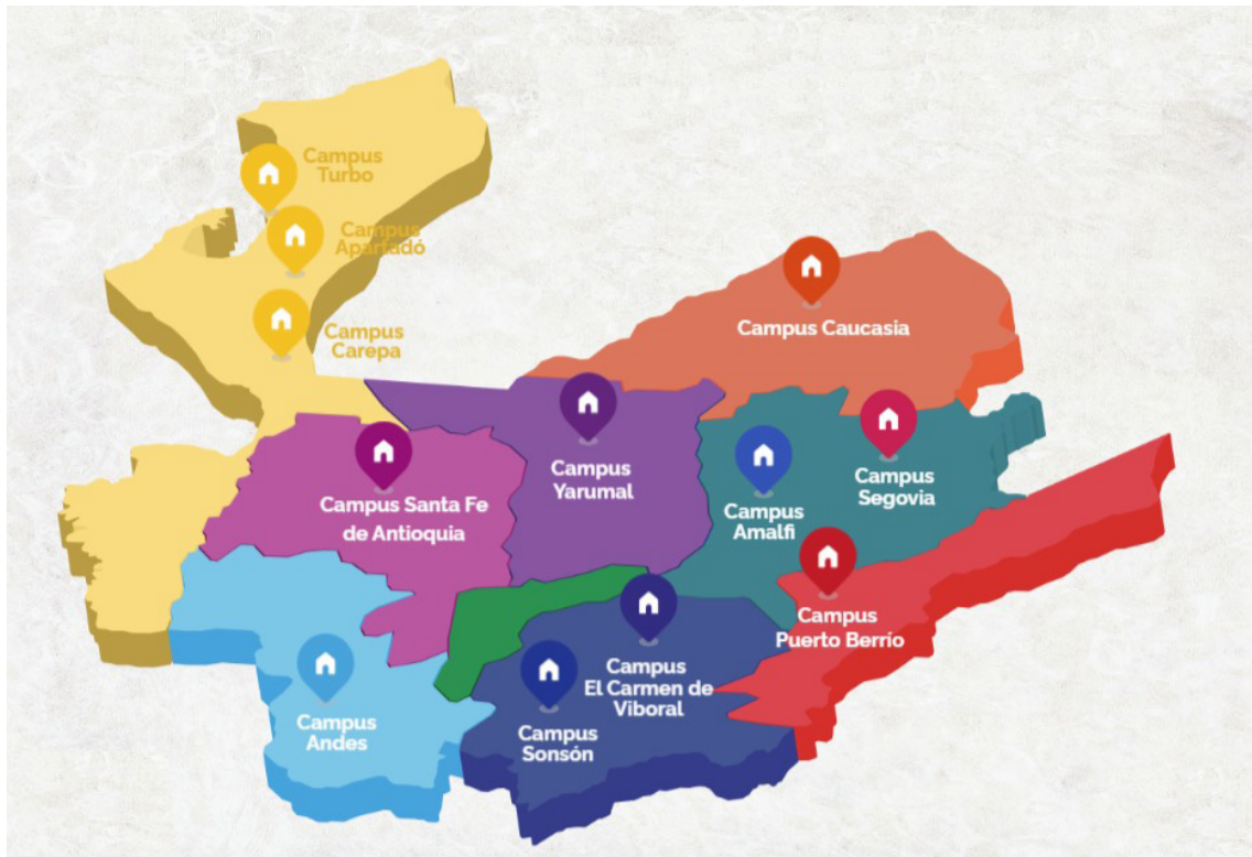
Figura 1. Universidad de Antioquia en las regiones del departamento.