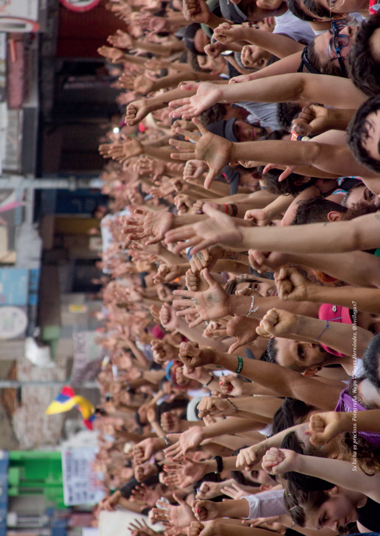
Su lucha es preciosa.