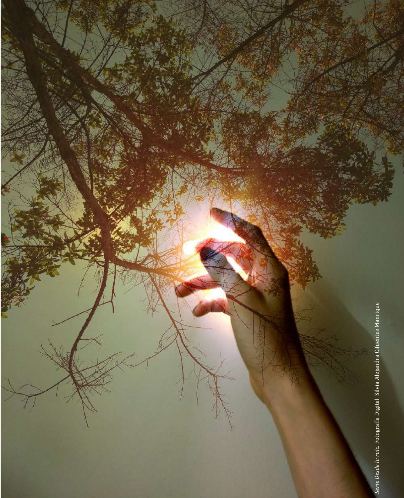
Serie Desde la raíz. Fotografía Digital. Silvia Alejandra Cifuentes Manrique