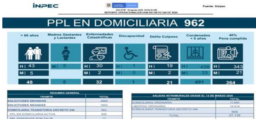
Gráfico n.º 1. Hacinamiento carcelario