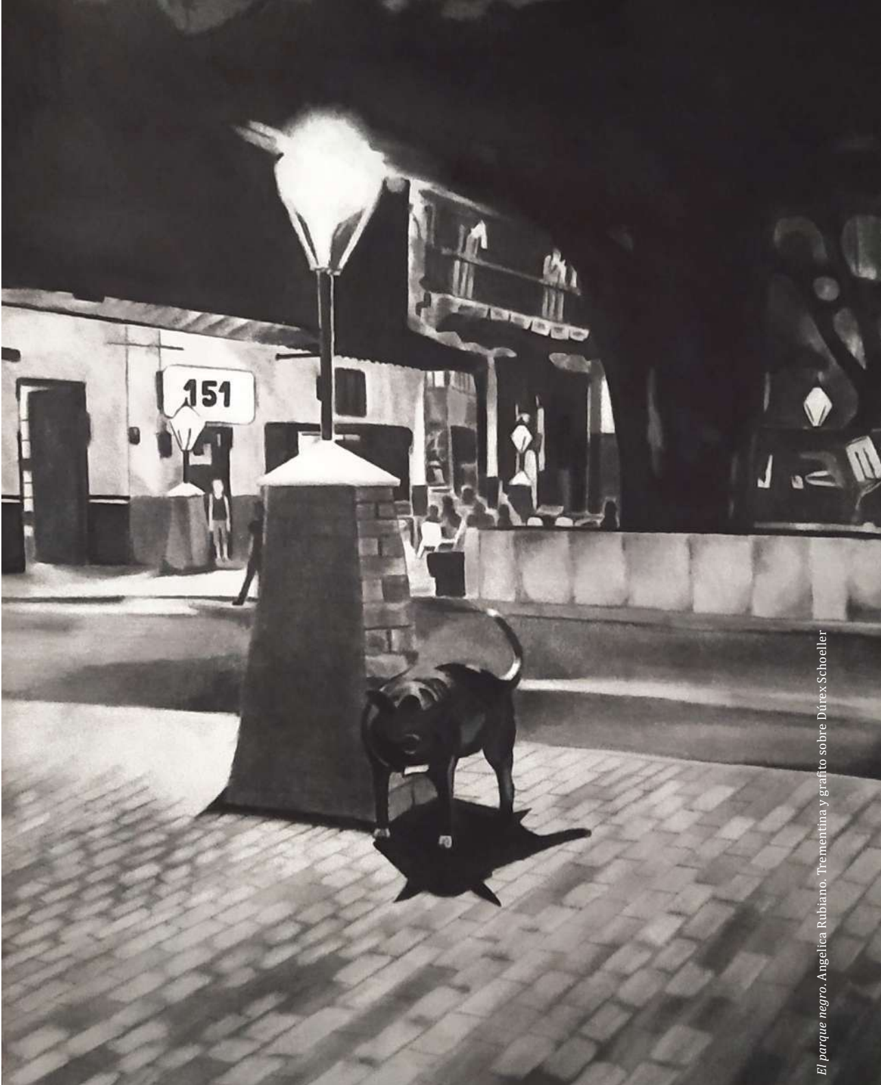
El parque negro. Angelica Rubiano. Trenzantina y grafito sobre Dixrex Schoeller