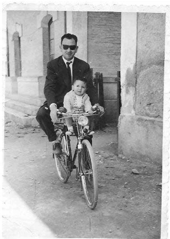
Figura 7. Alguien a quien quiero: mi padre. Recuerdo de infancia.