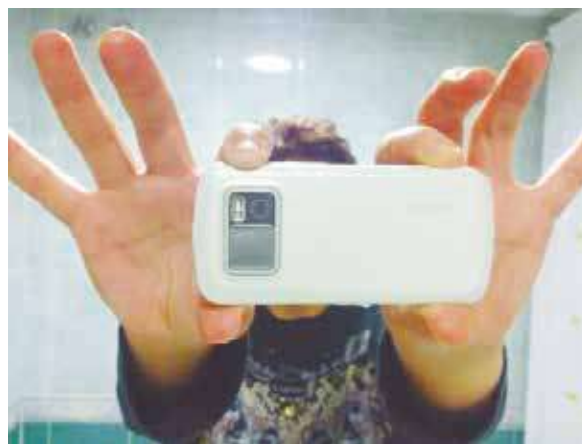
Figura 4. Mis manos