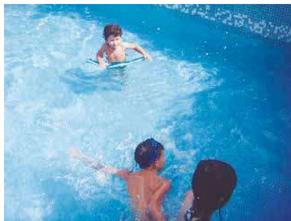
Figura 2. Color preferido (azul)