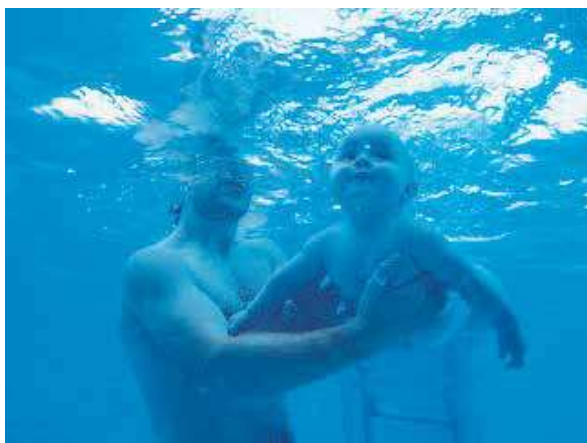
Figura 1. Color preferido (azul)

La fortaleza de los argumentos la detectamos con énfasis en aquellas experiencias que son muy vívidas, como por ejemplo, los recuerdos de la infancia o la representación de seres queridos. Estas temáticas aluden a relatos autobiográficos (Huerta, 2010), que si bien tienen un potente sentido identitario, no resultan perjudiciales en su potenciación como ilustraciones de vivencias compartidas. JG introduce una imagen de su infancia, en la que aparece con su padre, montado en una bicicleta (véase figura 7).