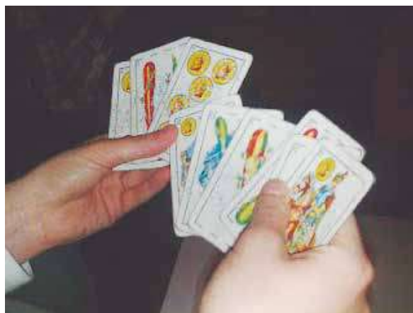
Figura 6. Mis manos