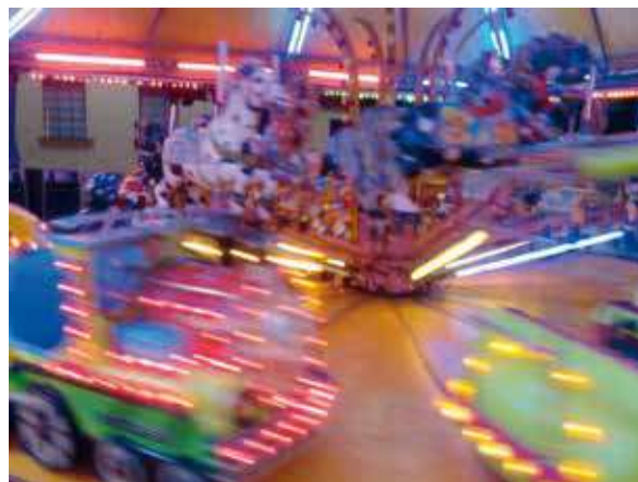
Figura 9. Recuerdo de la infancia