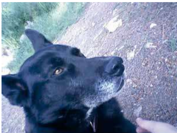
Figura 8. Alguien a quien quiero