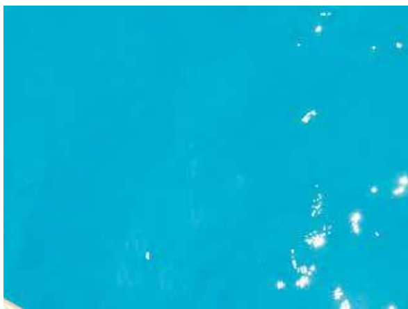
Figura 3. Color preferido (azul)