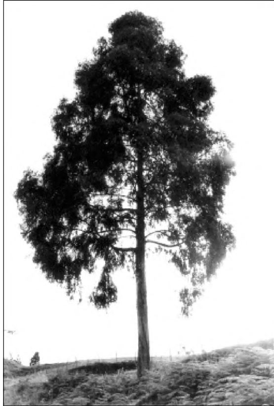
Santa Elena, 1984.