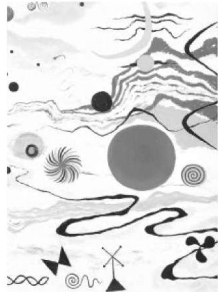
Alexander Calder, Fond clair , óleo sobre lienzo, 1949.