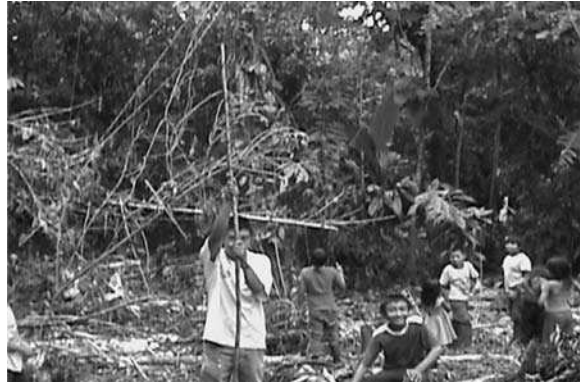
Figura 2. La “vara Tule” como unidad e instrumento de medida.