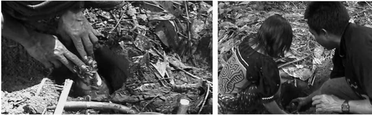
Figura 4. El maestro Richard Nixon Cuellar explica el proceso de la siembra del plátano a los estudiantes tule.

Desde los ideogramas, los estudiantes tule expresaron cómo fue el uso de las medidas naturales, cómo fue el proceso de realización del cultivo del plátano y cómo fue la idea de medida que desarrollaron.