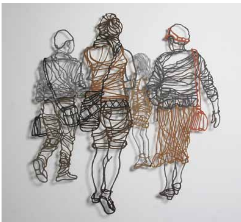
Peregrinos 110 cm x 105 cm Papel, cera y pigmentos 2009