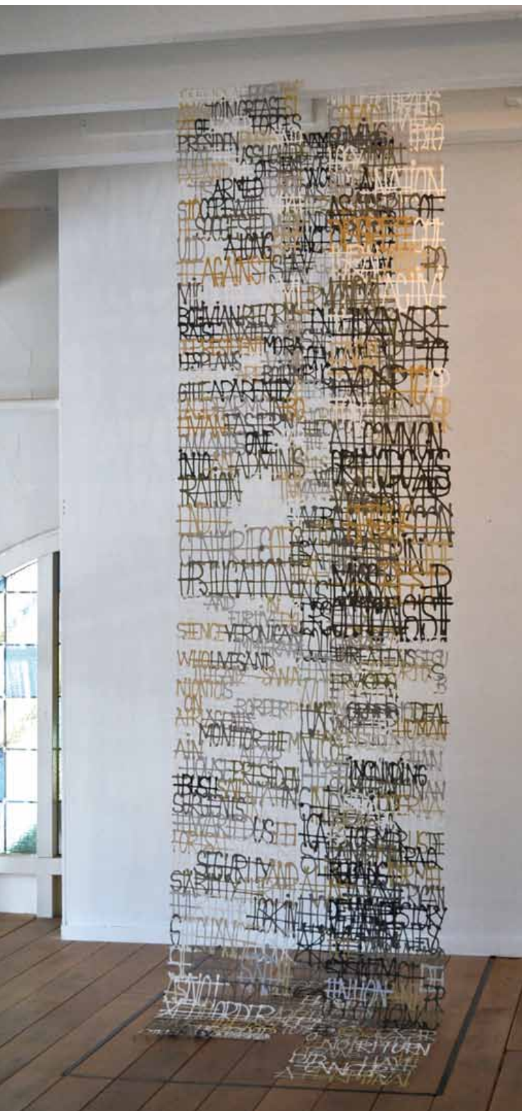
Noticias - Instalación 80 cm x 50 x 320 cm Papel y pigmentos 2012

Con mi trabajo artístico exploro nuevas posibilidades del dibujo en tercera dimensión. Transformo el papel en una especie de tinta con la cual dibujo o escribo y reinvento su función habitual de soporte. Al dibujar con pulpa de papel, las cualidades expresivas y narrativas del dibujo lineal se convierten en una red abierta de líneas. La obra instalada en el espacio permite que la luz se filtre y que las sombras emerjan, otorgándoles a los dibujos nuevas posibilidades de lecturas y significaciones. Mis dibujos representan en su mayoría escenarios urbanos, mapas de ciudades, diásporas de turistas que parecen perseguir sus propias sombras, peregrinos, inmigrantes y desplazados recorriendo un camino hecho de sombras y vacíos.