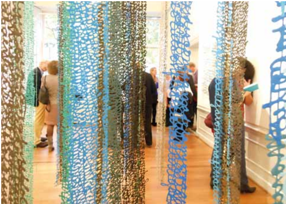
Testimonios - Detalle de instalación 300 cm x 300 cm x 220 cm Papel y pigmentos 2012