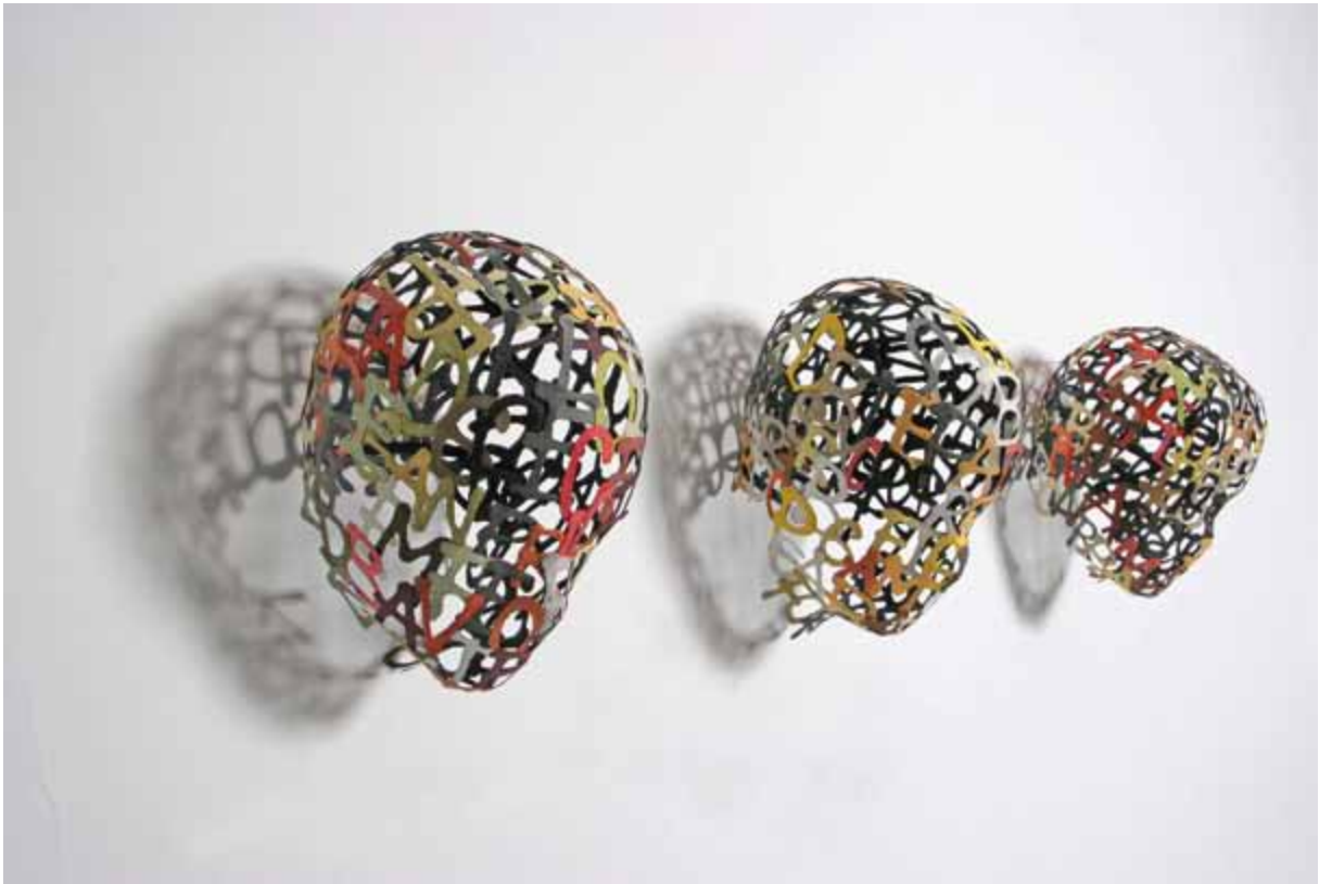
Nidos 21 cm x 30 cm x 30 cm Papel y pigmentos 2011