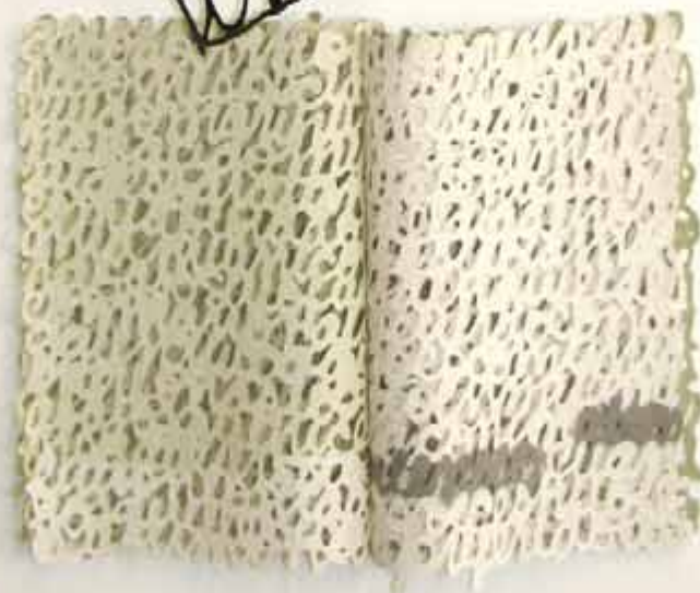
Tres libros 50 cm x 30 cm x 120 cm Papel y pigmentos 2006