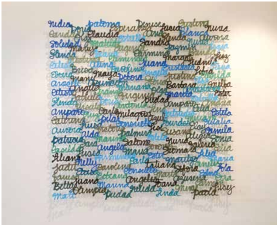
Nombres 110 cm x 120 cm Papel y pigmentos 2012