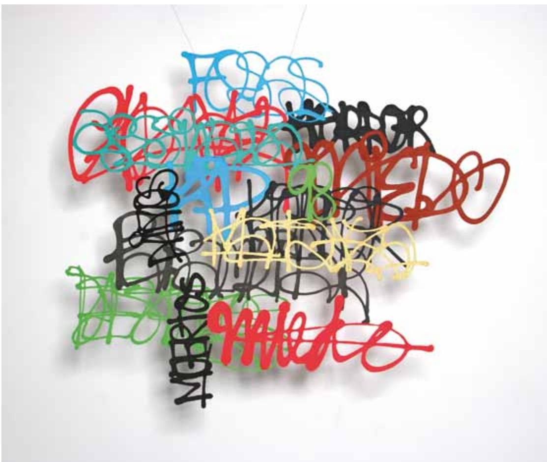
Graffiti 110 cm x 80 cm Papel y pigmentos 2008