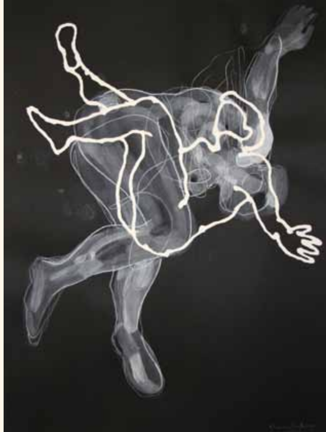
Danza 50 cm x 70 cm Dibujo con tinta sobre papel 2011