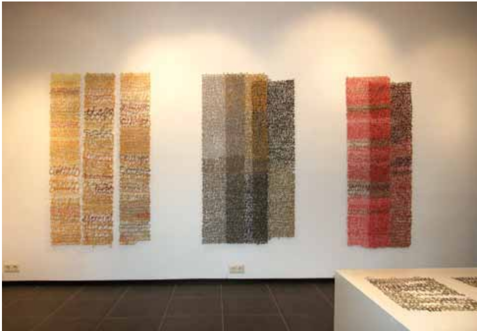
Tres cartas 150 cm x 100 cm, 150 cm x 105 cm, 150 cm x 70 cm Papel y pigmentos 2006