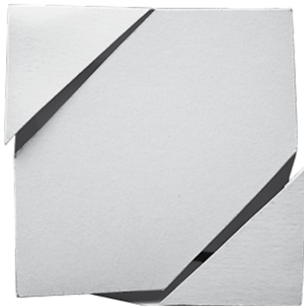
Desplazamientos , papel dúrex, 2014