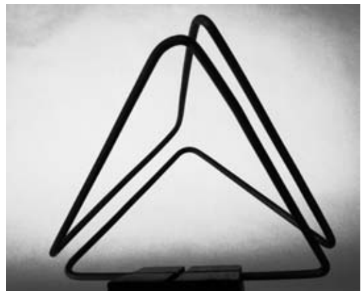
Dibujo en el Espacio , alambre, 2014