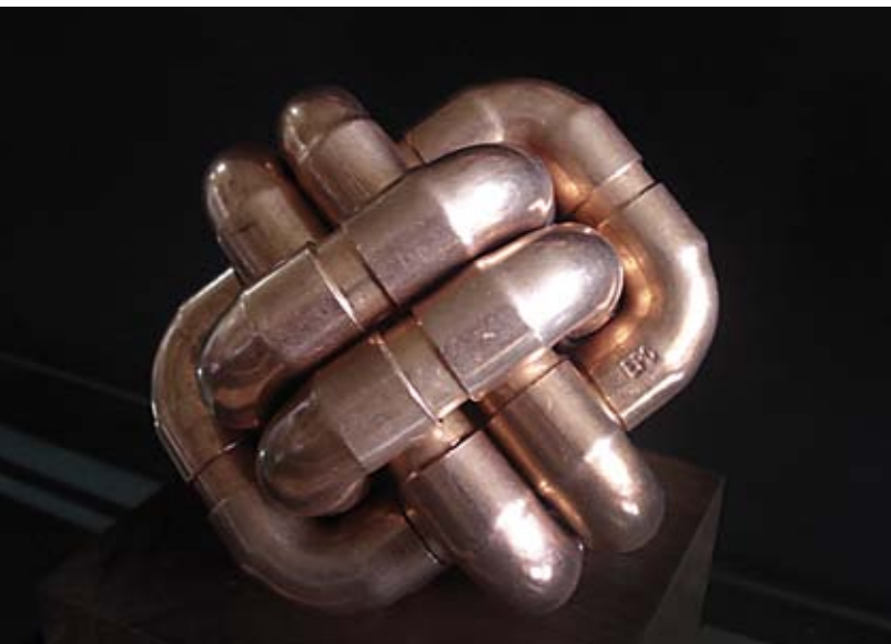
Nudo , tubería de cobre, 2013