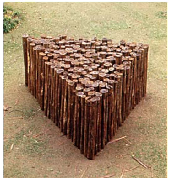
Triângulo espiral, Bienal de Sao Paulo, 1982