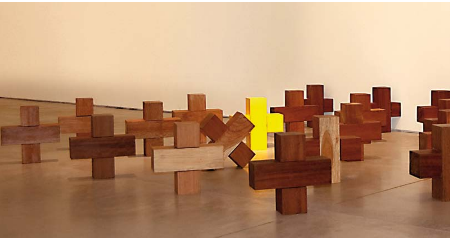
Más por más da más que , maderas, 1998