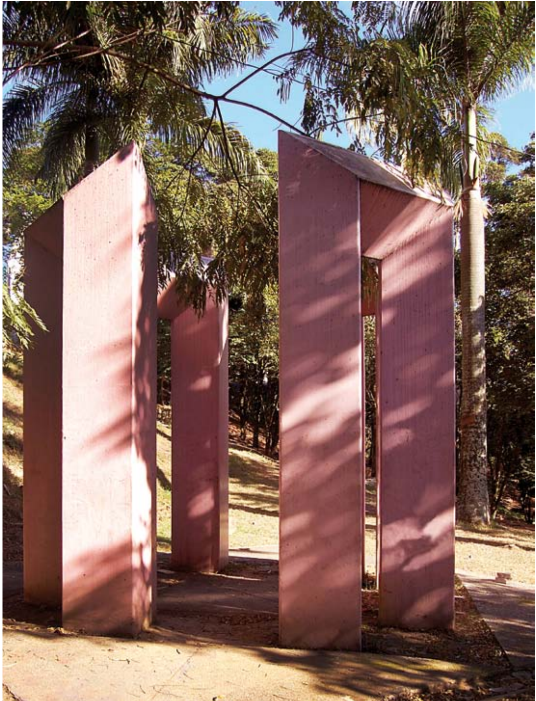
Umbrales , Cerro Nutibara, 1981