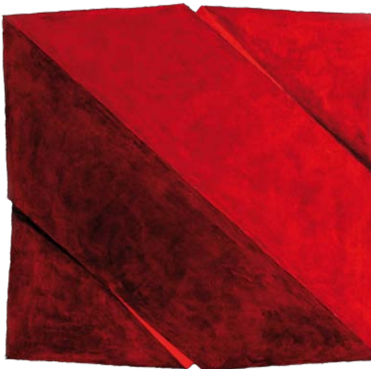
Acrílico sobre lienzo, 2014