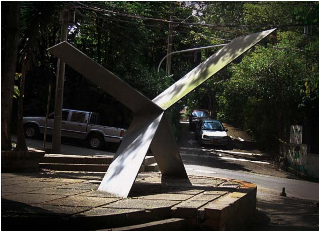
Cantos , Pinares del Castillo, Medellín, 1988