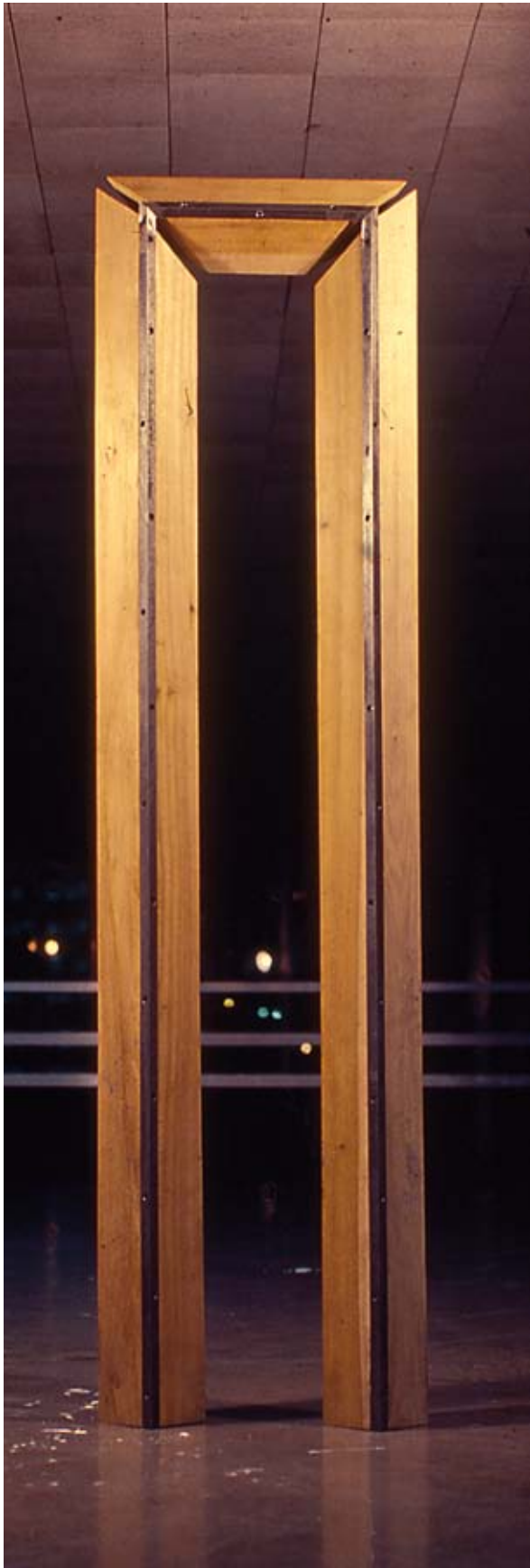
Pórtico, comino, 1981