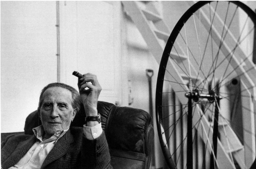
Duchamp por Henri Cartier-Bresson, 1968

En 1913 presentó la Rueda de bicicleta sobre un taburete , la primera manifestación de sus ready-mades , objetos “ya hechos”, casi siempre procedentes del mundo industrial, “elegidos” por el artista como obras de arte.