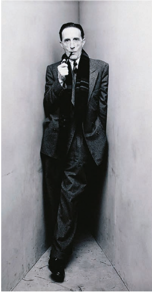
Duchamp por Irving Penn, 1948

● ..... La Fuente sigue vigente porque, en medio de la situación contemporánea, insiste en recordar que el arte no se refiere a categorías de cosas (como orinales o acuarelas), sino a tipos de valores, los cuales, como es obvio, no pueden encontrarse en las cosas mismas, sino en nuestros conceptos y razones. ..... ●