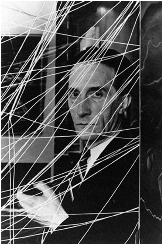
Marcel Duchamp inside "16 Miles of string", 1942

rechazado su obra en 1912; quizá quería poner a prueba la apertura del grupo de Nueva York frente a las ideas que en esa misma ciudad él ya había propuesto con sus ready-mades , en los cuales veía una nueva forma de escultura. Adicionalmente, era consciente de que la ruptura con las normas académicas que por siglos habían definido el arte, ruptura que en los Independientes se materializaba en la eliminación de los jurados, implicaba moverse en un campo minado donde el arte había perdido toda certeza y que, por tanto, exigía nuevos criterios para enfrentar las obras. Le fascinaban los juegos de palabras y quizá podemos especular que dejó una prueba bastante hermética de ello en la firma y en el título de la obra. Pero, más allá de todas estas suposiciones, es bastante obvio que Duchamp esperaba que su Fuente se expusiera: sabía que se trataba de una provocación que necesariamente generaría un cierto escándalo, pero también debía tener claro que ese objetivo solo se lograría si el público podía ver la obra.