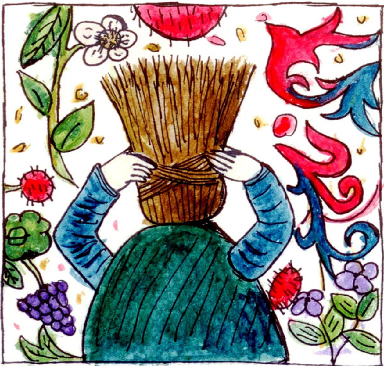
Ilustración propia basada en un detalle de Le Livre des hystoires du Mirouer du monde , depuis la création, jusqu'après la dictature de Quintus Cincinnatus. (BnF, MS 328, f.8r. 15th century). Acuarela sobre papel.