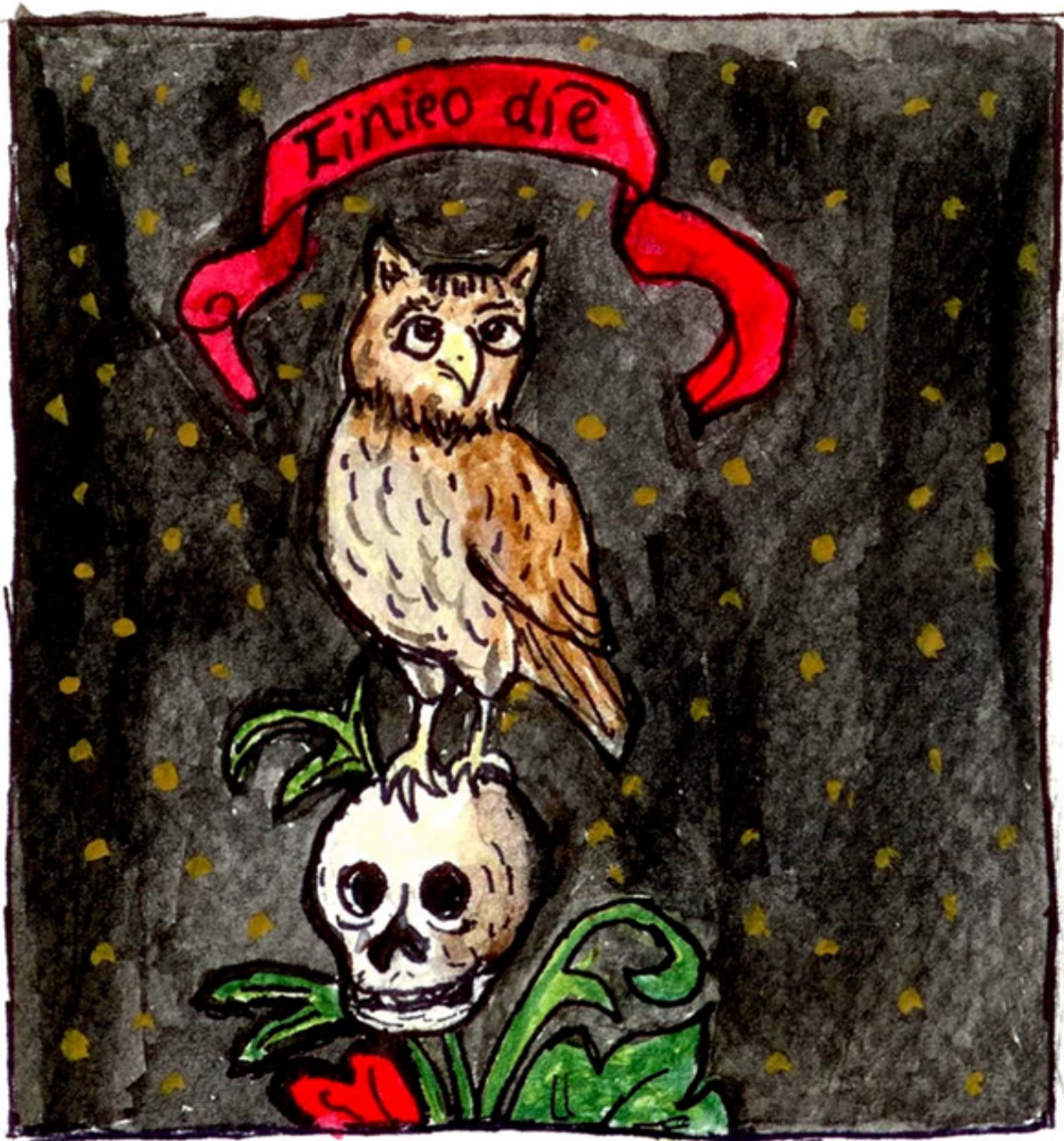
Ilustración propia basada en un detalle de Office of the Dead (MS 0118, f. 281. Early 16th century. Acuarela sobre papel.