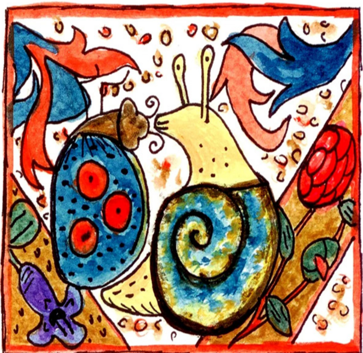
Ilustración propia basada en un detalle de Book of Hoursuse of Chalon, (MS 6881 f. 72r). Acuarela sobre papel.