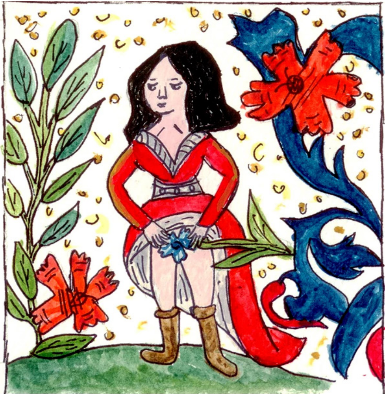
Ilustración propia basada en un detalle de Book of Hours (Ms. 0482, f.60v). Acuarela sobre papel.