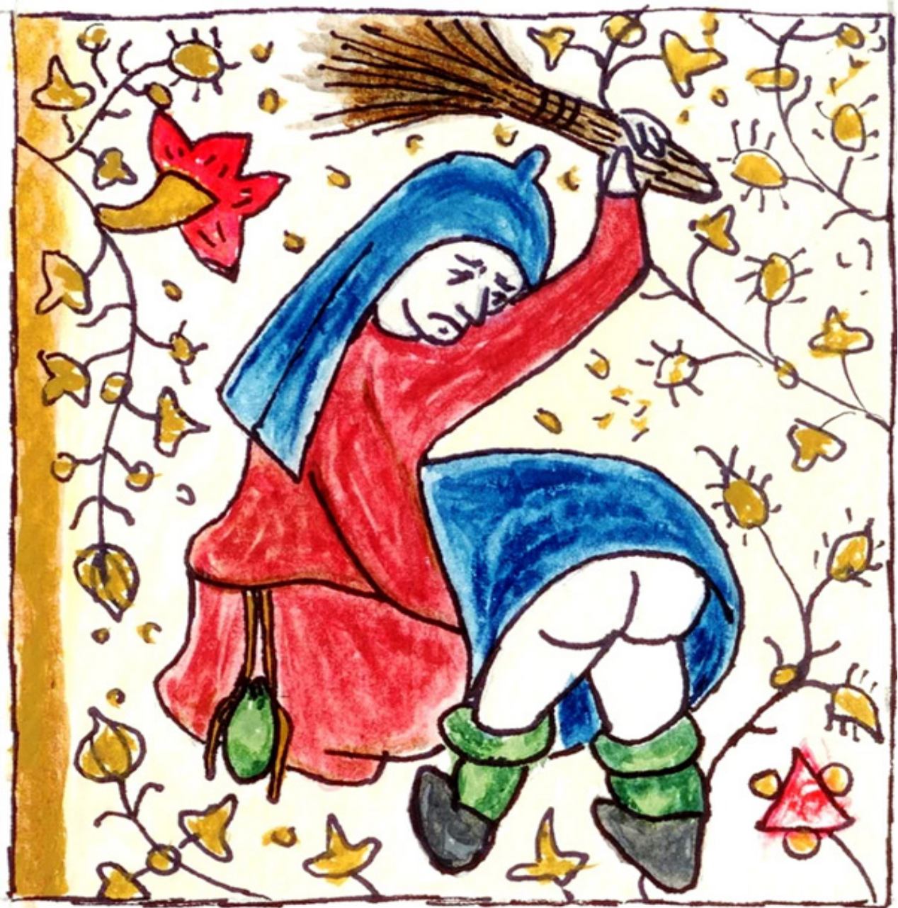
Ilustración propia basada en un detalle de Book of Hours, (MS M453 f. 139r). Acuarela sobre papel.