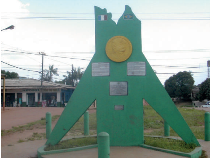
Foto 1. Stéphane Granger, “Monumento em Oiapoque erguido em 2000, comemorando o centenário da anexação do Contestado ao Brasil, com uma placa homenageando a cooperação transfronteiriça com a Guiana Francesa” (imagem digital) Oiapoque, 2013. Coleção particular.