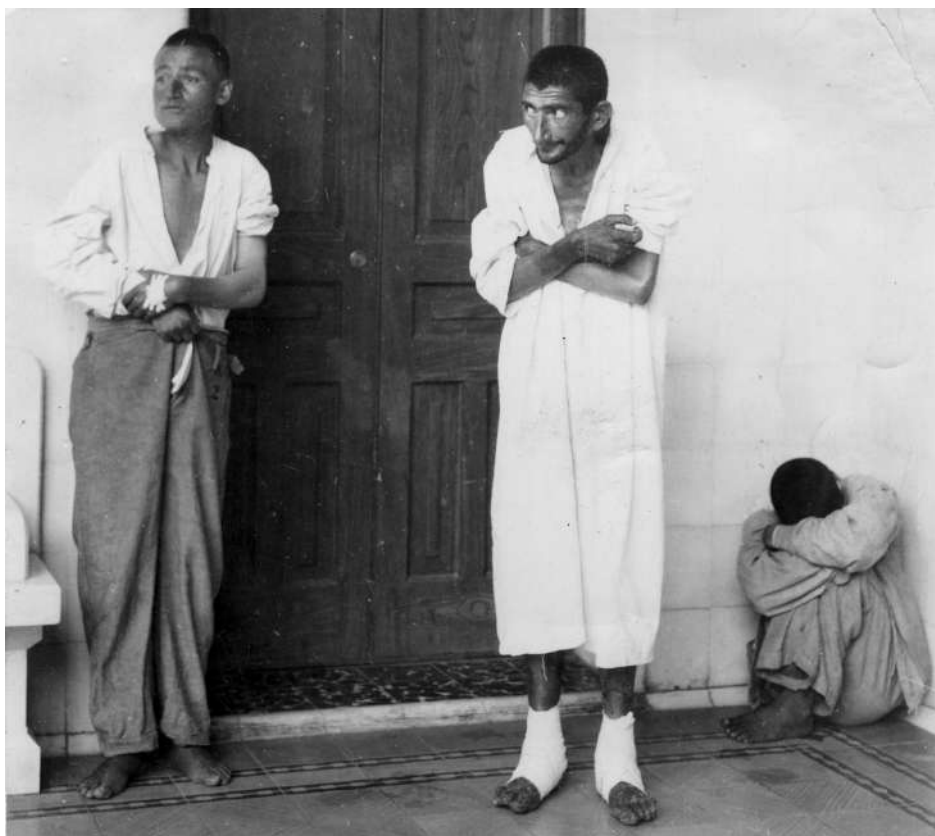
“Grupo de esquizofrénicos, retrato” (impresión plata sobre gelatina (entonada y manipulada: 10.2 x 12.7 cm.), México, D.F. c. 1940. No. Inv. 461041.