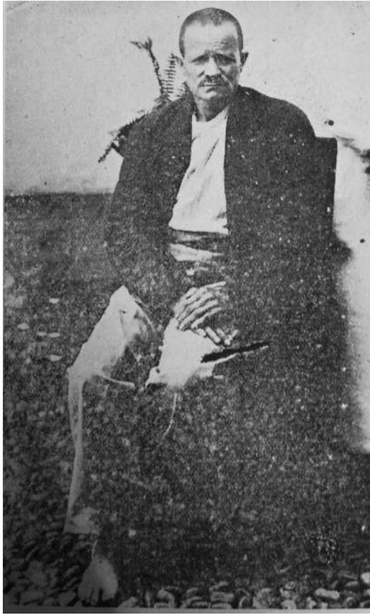
Imagen 3. Paralítico, forma demencia simple