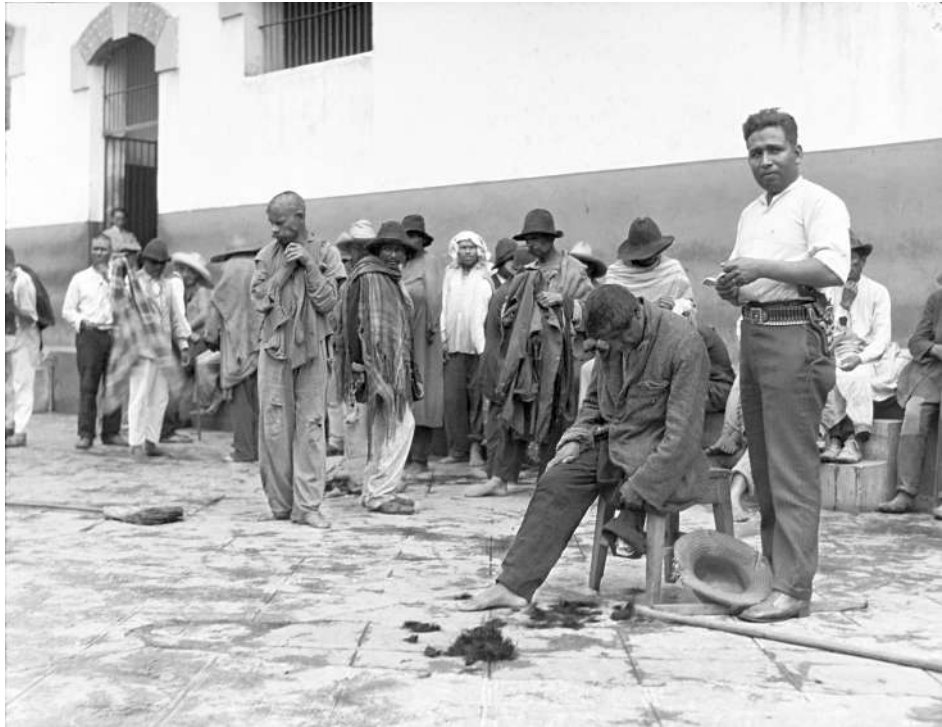
“Peluquero corta el cabello a interno de La Castañeda” (negativo de película de nitrato: 12.7 x 17.8 cm.), México, D.F. c. 1935. No. Inv. 366986.