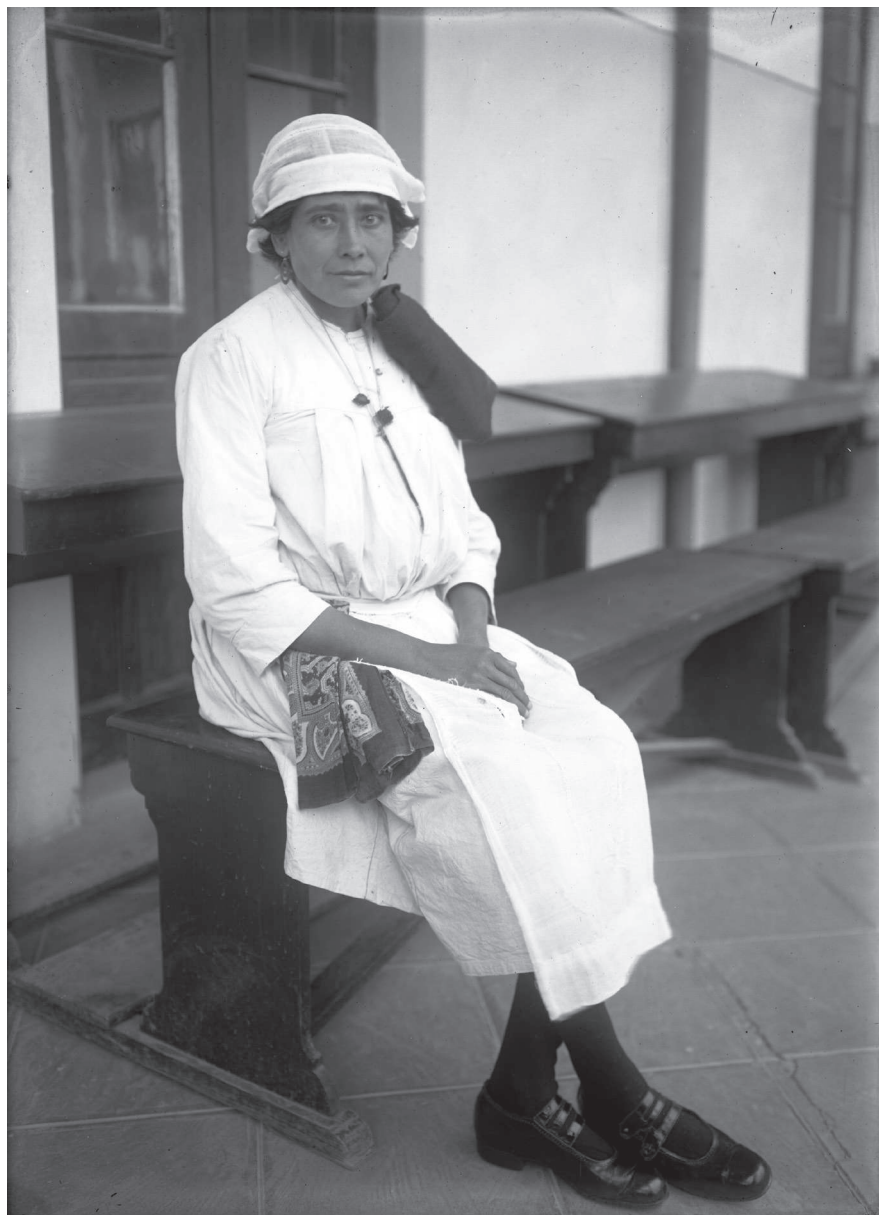
"Mujer, retrato" (placa seca de gelatina: 12.7 x 17.8 cm.), México, D.F. ca. 1915-1920.