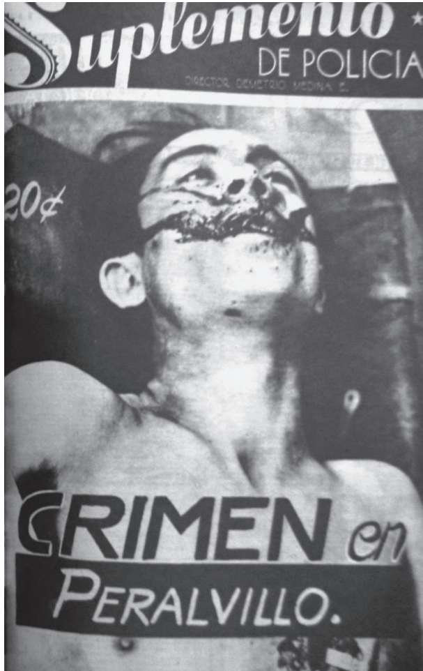
Figura 2. Crimen en Peralvillo