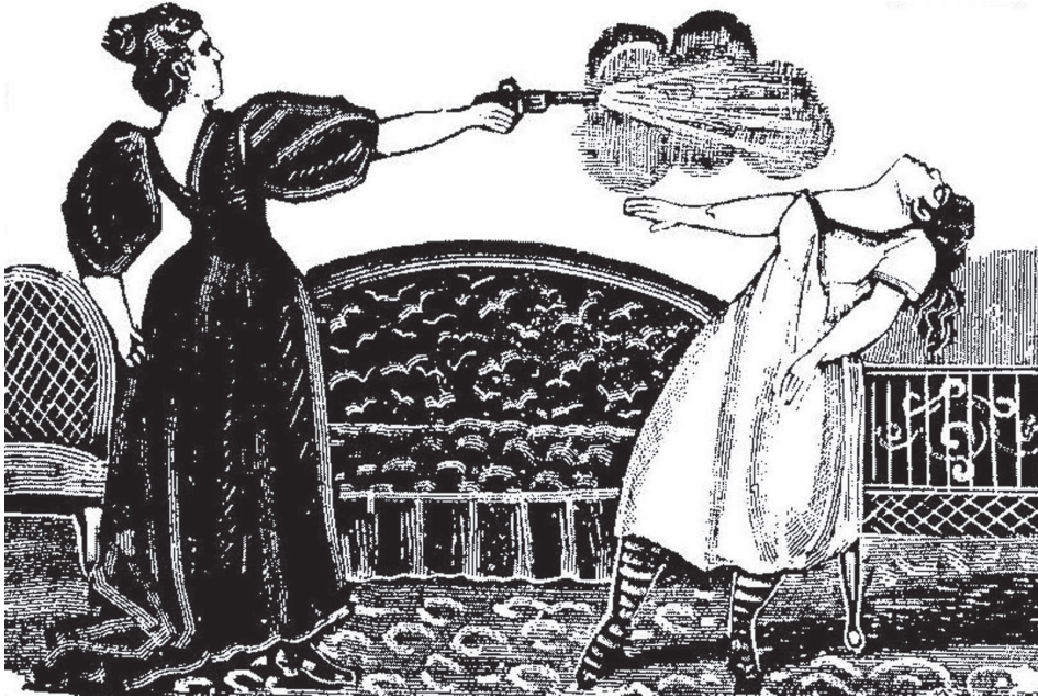
Figura 1. El crimen de María Villa