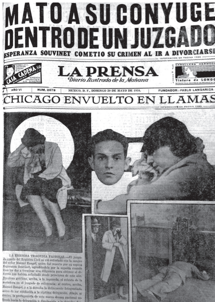
Figura 3. Mató a su cónyuge dentro de un juzgado