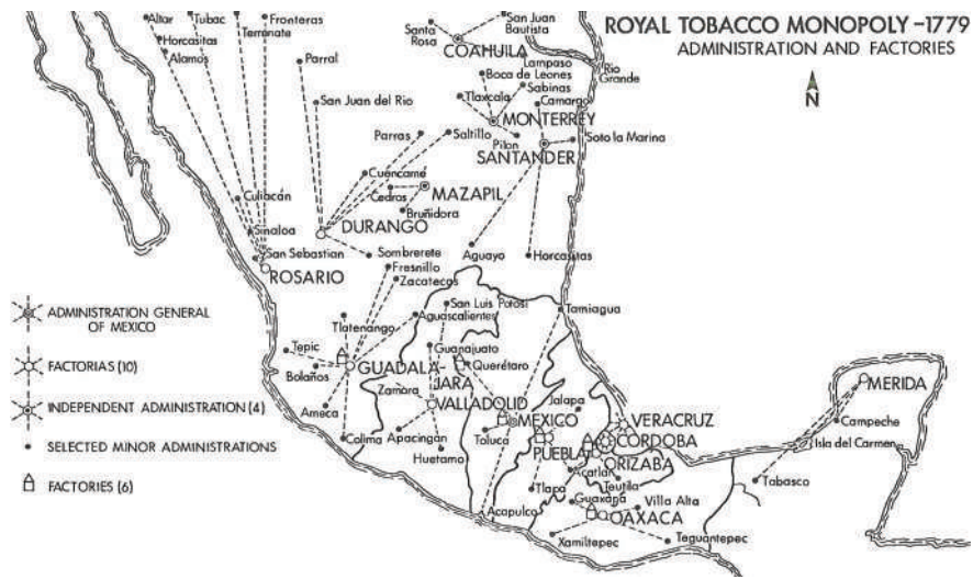
Figura 2. Organización espacial del monopolio del tabaco