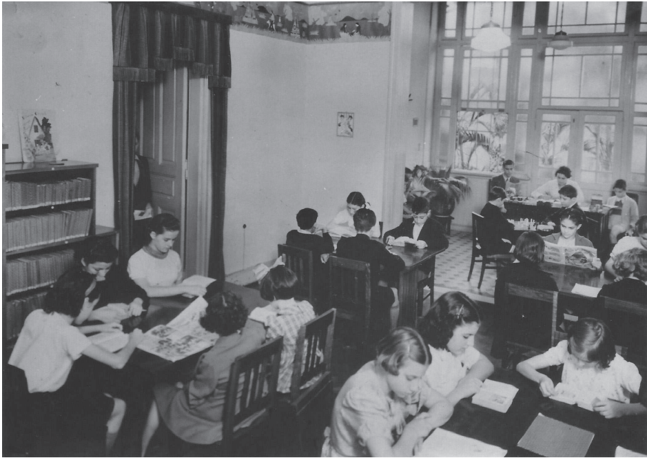
Figura 3. Meninos e meninas na sala de leitura