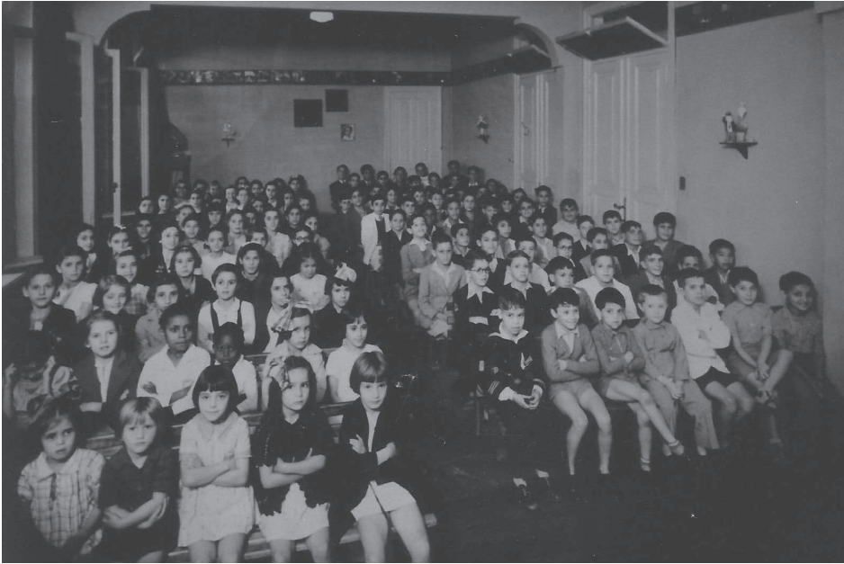
Figura 2. A Sala de Projeção da Biblioteca Infantil repleta de crianças