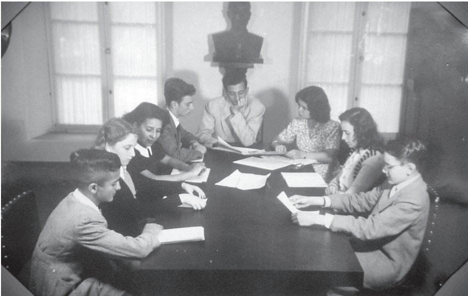
Figura 5. Reunião da Diretoria do Jornal A Voz da Infância