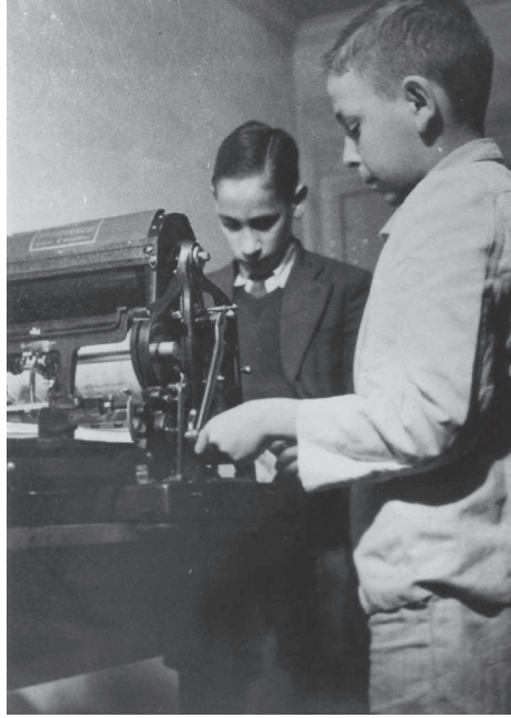
Figura 4. Crianças imprimem o jornal A Voz da Infância em um mimeógrafo