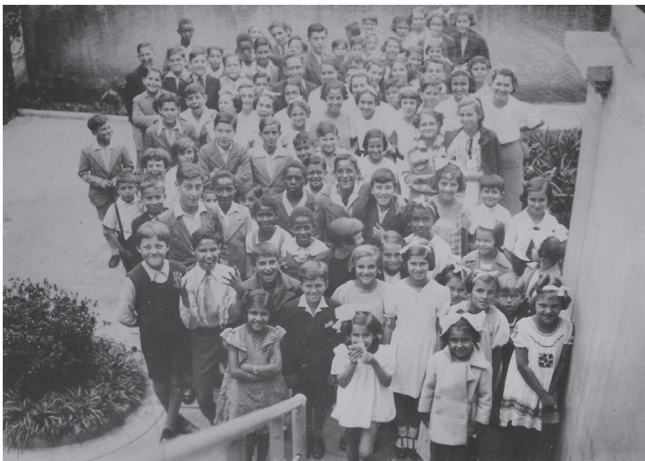
Figura 1. Crianças esperam pela sessão de cinema na Biblioteca Infantil