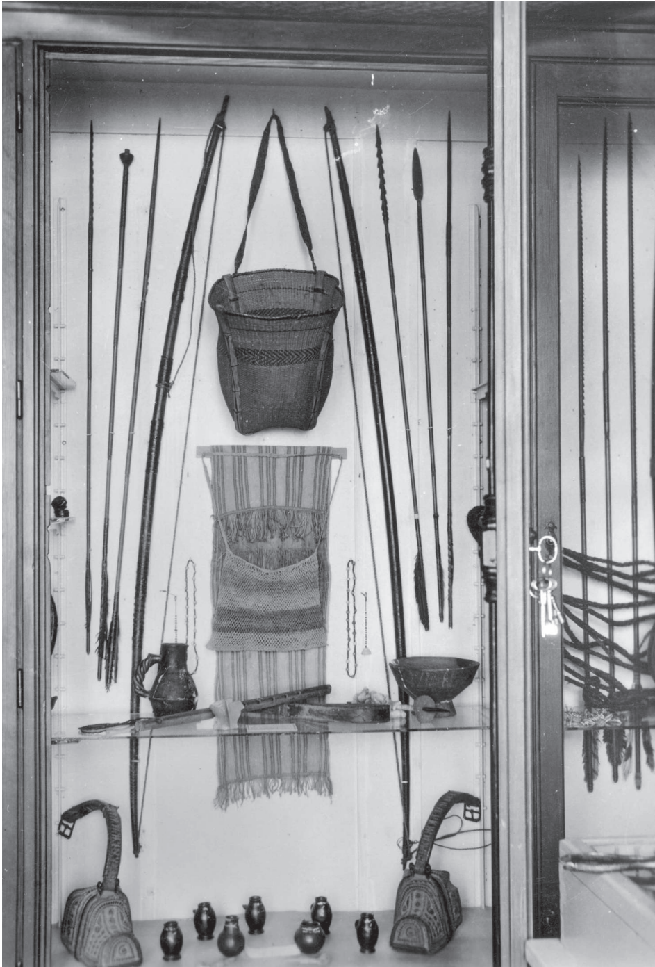
Figura 2. Vitrina Indios Caiaguá. Sala "América"