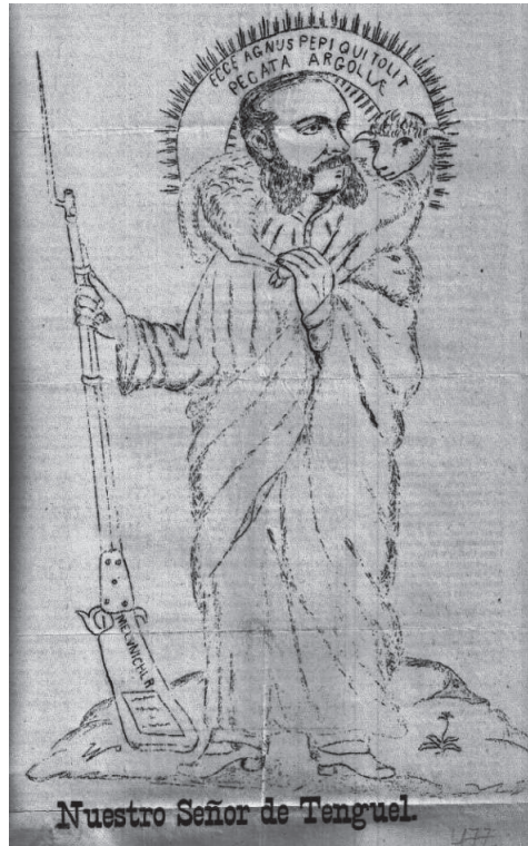
Figura 4. Nuestro señor de Tenguel