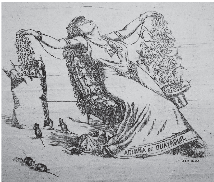
Figura 2. ¡Mater amabilis!

Fuente: Fray Gerundio (Guayaquil) 31 de octubre de 1885: 3.