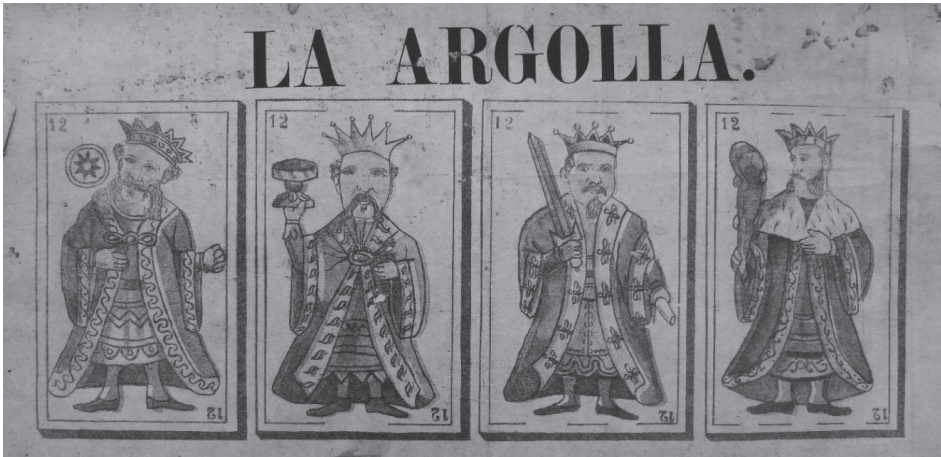
Figura 3. La Argolla. Figuras de la baraja ecuatoriana