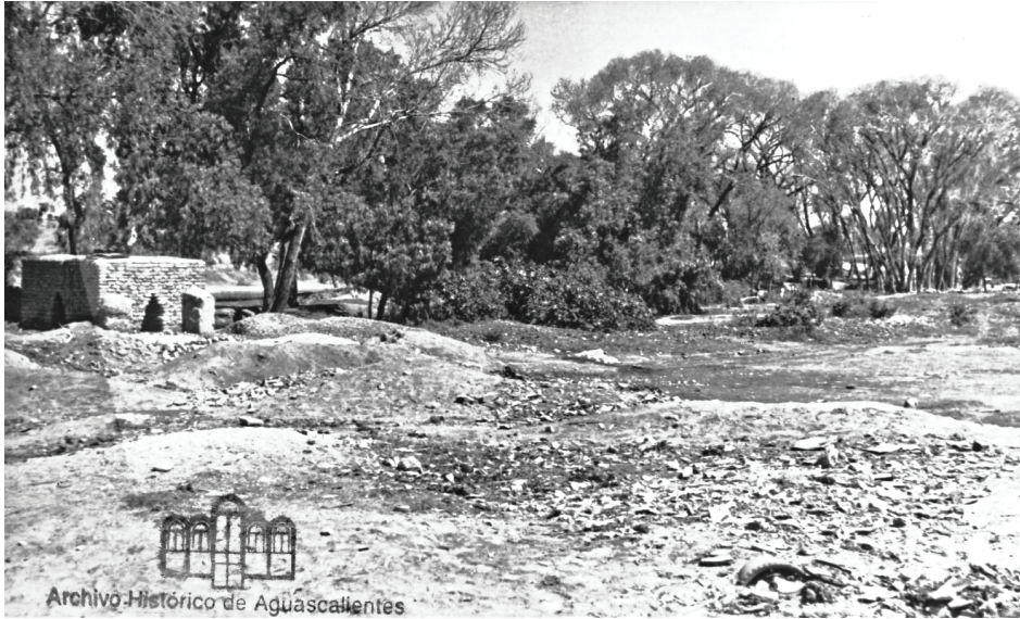
Figura 4. Fábrica de ladrillos ubicada junto al cauce del arroyo