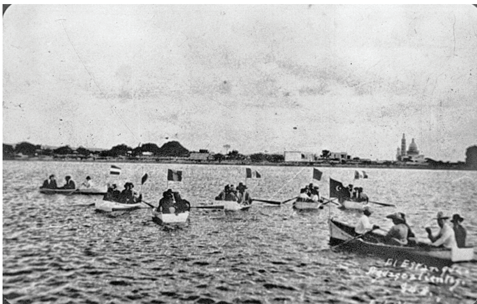
Figura 2. El estanque de La Cruz