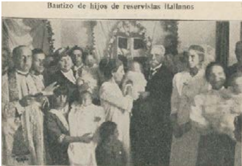
Figura 10: Bautizo de hijos de reservistas italianos.