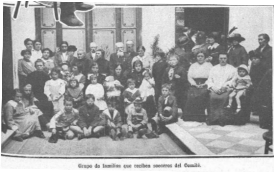
Figura 13: Grupo de familias que reciben socorros del Comité.