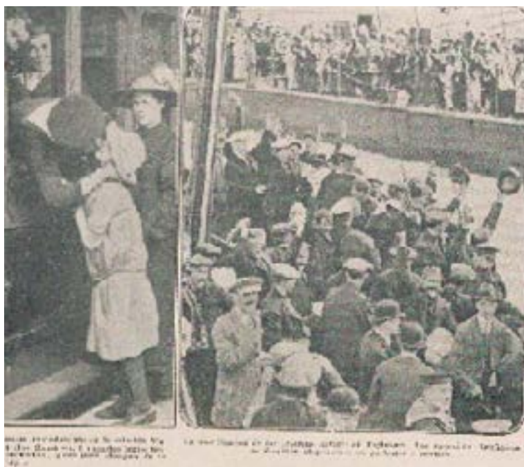
Figura 8: Despedidas de soldados ingleses en Europa.