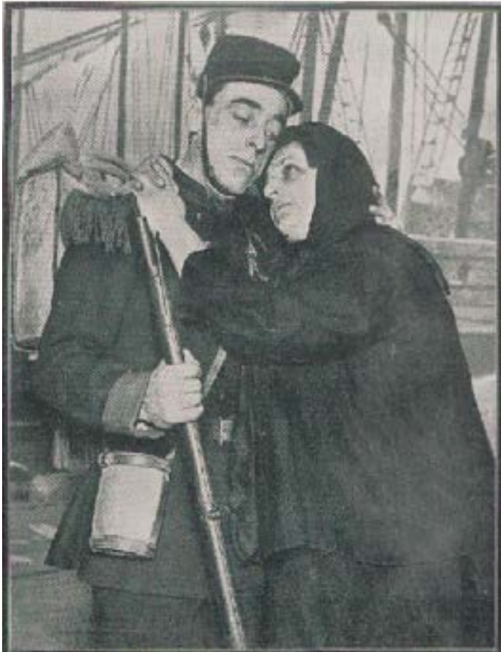
Figura 6: Cuadro artístico. ¡Maldita sea la guerra!