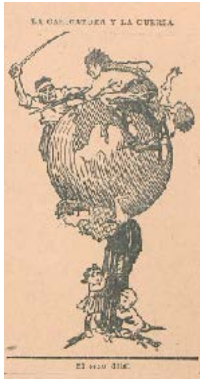
Figura 12: La caricatura y la guerra.