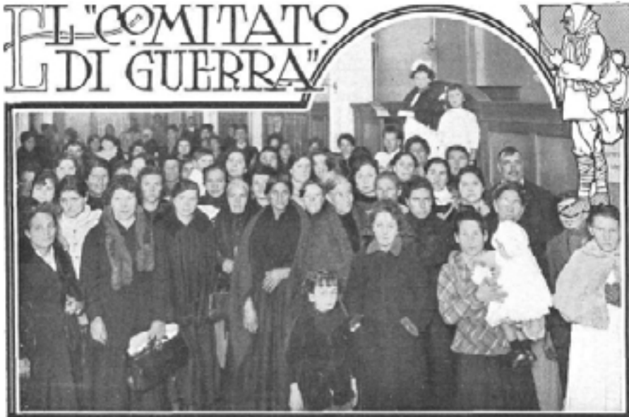
Figura 11: El Comitato Di Guerra .