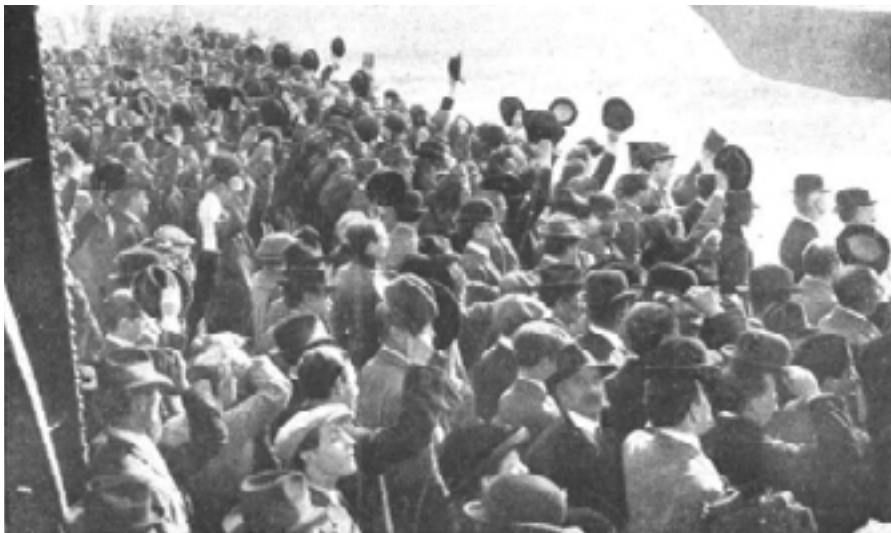
Figura 2: Contingentes de reservistas de ingleses y franceses, que van a la guerra europea.