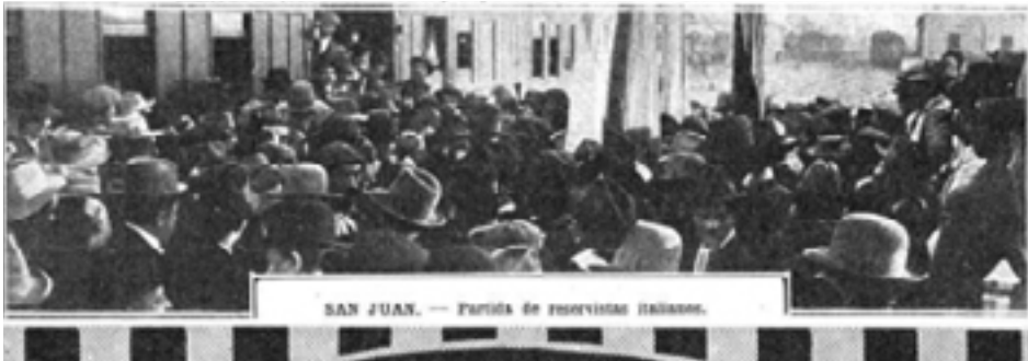
Figura 4: San Juan - partida de reservistas italianos.