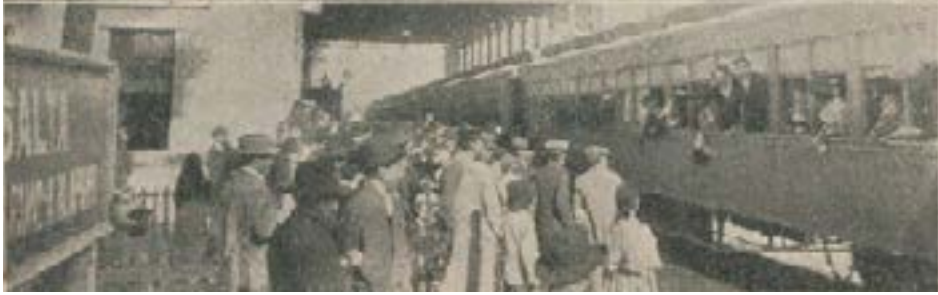
Figura 3: Salta - partida de reservistas italianos.