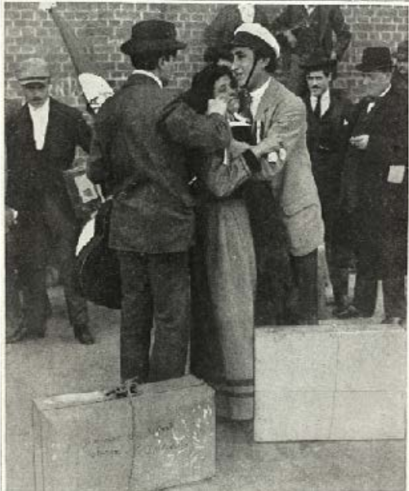
Figura 7: Despedidas en el Puerto de Buenos Aires del séptimo contingente de italianos.