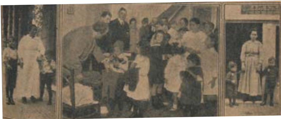
Figura 9: Liga Filantrópica Ítalo-Argentina.