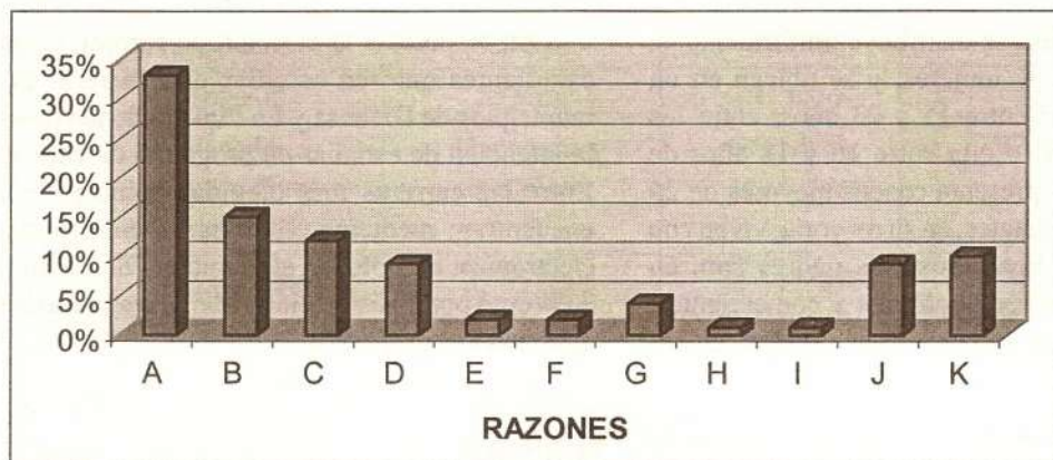
Gráfica 3 Razones que justifican la elección de carrera

Cuando se pregunta por el origen y razón que justifica la elección de carrera, el 31% de los estudiantes utiliza la frase: "me gusta" al referirse a la carrera elegida como primera opción; el 17% expresa que su carrera les permite colaborar e interactuar socialmente; además, el 6% manifiesta que tienen aptitudes en dicho campo. Así mismo, en el municipio de Barbosa, un 18% aduce que el programa elegido presenta mayor demanda laboral; y el 9% tiene la intención de ser profesionales y salir adelante ( Ver gráfica 3 ). Ahora bien, que la mayor parte de los estudiantes expresen que su carrera "le gusta", refleja que posiblemente la elección de carrera es un asunto inconsciente y por tanto, no saben dar cuenta de sus razones y orígenes.