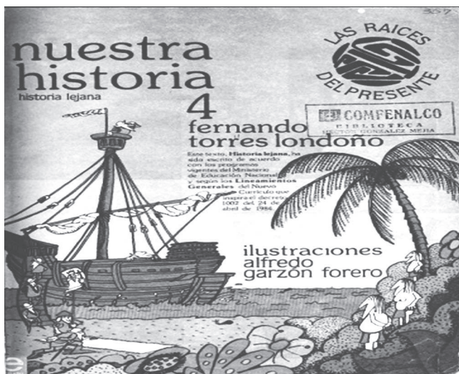
Imagen 1. TORRES LONDOÑO, Fernando (1984). Nuestra historia , 4°. Bogotá: Editorial Estudio.

Pretendo primero que todo, que el niño comience a sensibilizarse con la historia verdadera de su país y comience a percibir que la historia ni es un inocente cuento de caperucita ni es tampoco un cuento aburridor de nombres y fechas que tiene que aprenderse de memoria; que comience a descubrir, por el contrario, que la historia es algo tan importante que está influyendo su vida y su medio social de hoy (1984: 2).