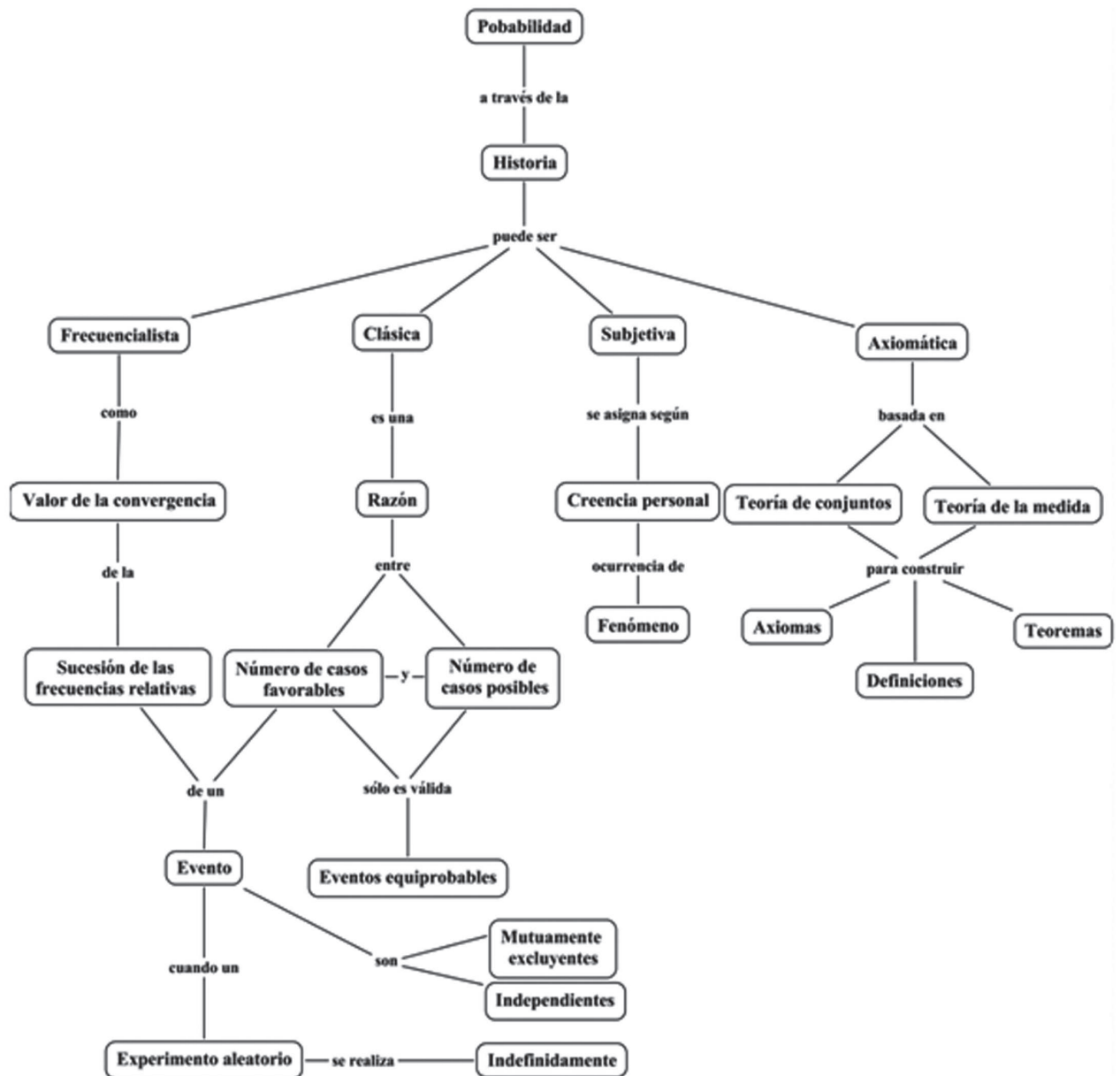
Figura 2. Diferentes tipos de probabilidad.

Cada grupo de estudiantes empezó a indagar sobre el tema elegido, las condiciones en que se presenta y algunas ideas de cómo resolverlo. Además, se les propusieron algunas actividades para explorar las distintas concepciones de probabilidad que se han dado a través de la historia, como un insumo para la solución del problema de interés. Se inició con el desarrollo de la actividad Lo probable y lo improbable , con la cual se pretendió que los estu-