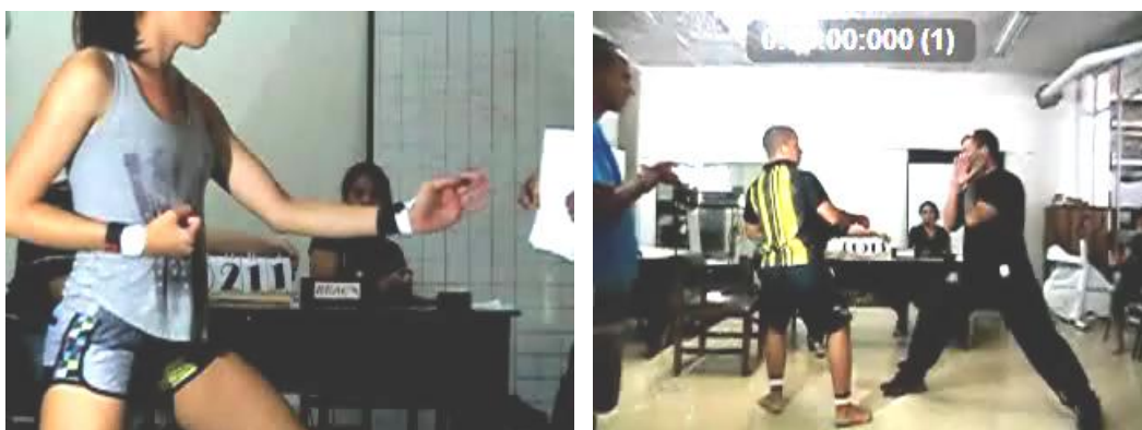
Figura 2. Izquierda: ataque con mano. Derecha: ataque con pie.

Procedimiento: a los participantes se les explicó el objetivo de las pruebas y se les permitió la realización de ensayos previos hasta que no presentaron errores con respecto al desempeño esperado en cada prueba descrita. Los calentamientos los realizaron individualmente. A cada sujeto se le filmaron tres intentos en cada variable y por cada segmento corporal. Primero se realizaron las pruebas generales y luego las pruebas específicas. Para la edición de los videos se utilizó el programa Kinovea, el cual permite la edición de la velocidad del video y la visualización del cronómetro (figura 1 y 2). El mismo programa permite la captura de los datos y la exportación a Excel.